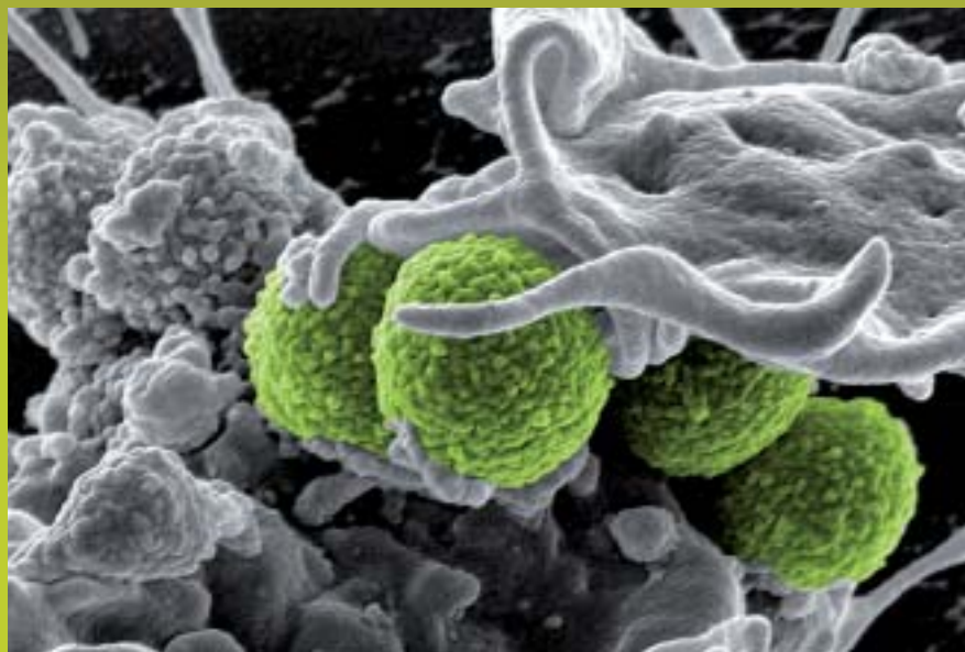
MRSA bakterioen (berdeak) eta leukozito baten arteko elkarrekintza.