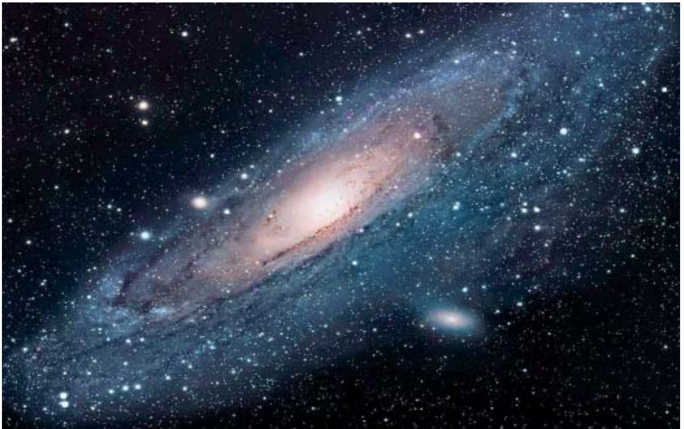
Andromeda galaxia, M31. Edwin Hubble astronomoak frogatu zuen M31 motako galaxia espiralak gure Esne-bidetik at dauden izar-multzok direla. Hortaz, galaxia horien errotazioa beharrezkoa den fenomeno dugu, baina fenomeno horren azalpena aurkitzea ez zen erraza izan.

argi utzi zuen hodei moduko entitate horiek geure galaxiatik at daudela. Horretarako, NGC 6822 eta M31 galaxiak erabili zituen laborategi modura (garai hartan oraindik “nebula espiral” moduan ezagunak). Modu jakin batean distira aldatzen duen izar-mota berezi baten segimendua eginez (zefeida izarrak), nebula horiekiko distantzia kalkulatu zuen; distantzia hori Esne-bidearen taiminarekin alderatuz, ondorioztatu zuen