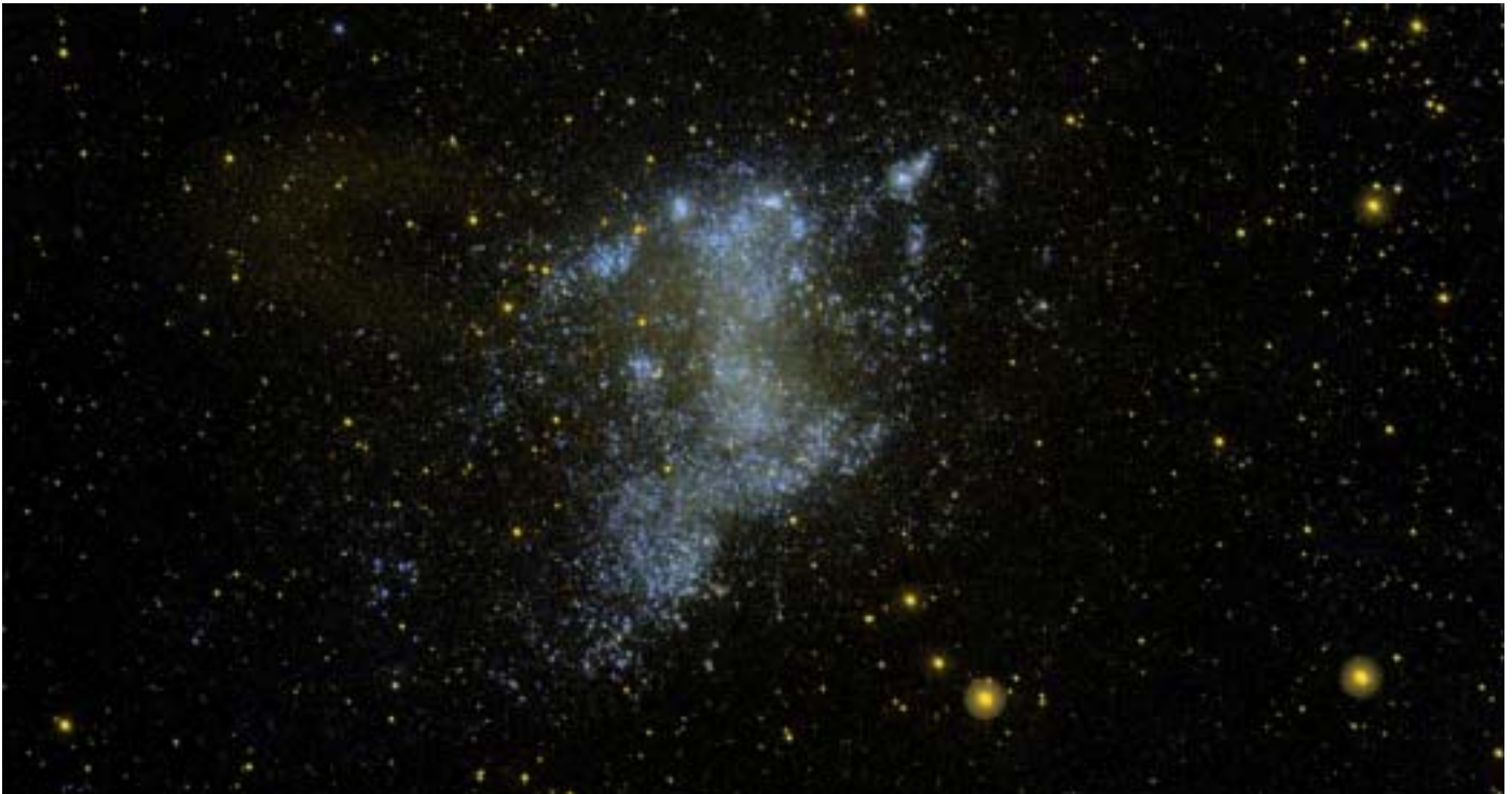
NGC 6822 galaxia. Edwin Hubble astronomoak erabili zuen, M31 galaxiarekin batera, izar-multzo haiek Esne-bidetik kanpo daudela baieztatzeko, alegia, galaxiak direla baieztatzeko.

kin. Zirkulu berezi horri korrotazio deritzo, eta hura neurtzea patroï-abiadura aurkitzearen baliokidea da, bi magnitudeak erlazionatzen dituen ekuazioa baitago. Korrotazioa aurkitzeko, zenbait metodo asmatu izan dira, sinpleenak morfologian oinarrituta. Egitura bereziren bat orbita zehatz batekin lotuz, korrotazioa aurkitu daiteke; adibidez, eratzun moduko egiturak orbita berezi batzuekin identifikatuz, posible da korrotazioa zehaztea. Beste metodo batzuek, neuritutako abiaduraren mapan oinarriturik, posizio hori zehaztea ahalbidetzen dute (Tremaine-Weinberg, adibidez). Azkenik, ahalegin handia egin da galaxien portaera simulazio hidrodinamikoak erabiliz ordenagailuen bidez irudikatzeke, eta, zenbait kasutan, posible da simulazio horiekin patroï-abiaduraren balioa mugatzea.