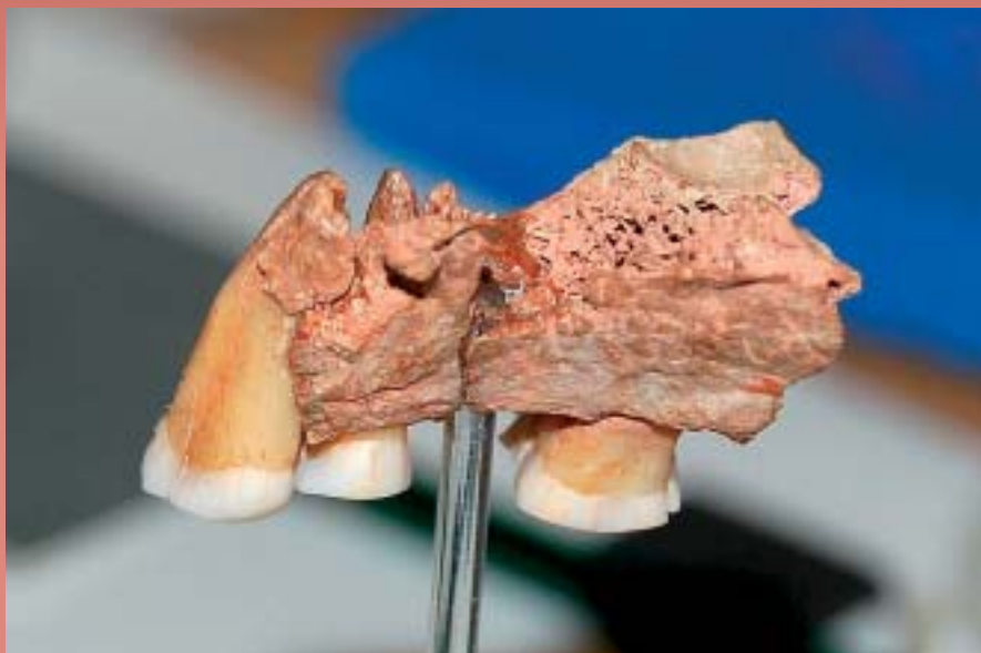
Kents Cavern kobazuloan aurkitutako masailezurra.

Ingalaterran, bestalde, berriz datatu dituzte Oxford Unibertsitateko eta Laborategi Nazionalako ikertzaileek Kents Cavern kobazuloan giza masailezur batekin batera aurkitutako animalia-aztarnak, eta 41.000-45.000 urte dituztela ondorioztatu dute. ●