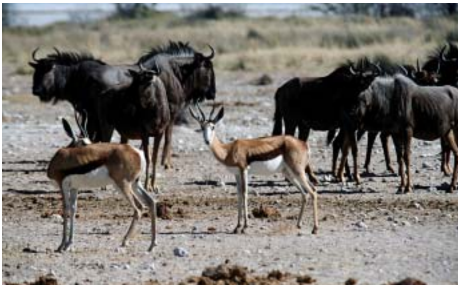
Animaliek DNA-arrastoak uzten dituzte lurrean, eta horiek aztertuta biodibertsitatea ezagutu daiteke.