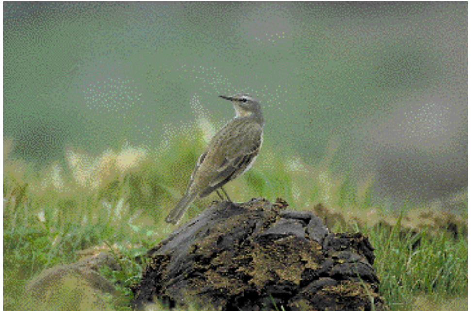
Mendietako larreetan, bizi den arren, neguan hezeguneetara jaisten da.

Noizean behin kolore arreak dituen txori hauetako bat landuta, ea gai garen identifikazio zaileko espezie hauen ezagutza menperatzeko. Baina... lasai, neronek ikusitako azken "txori arrea"