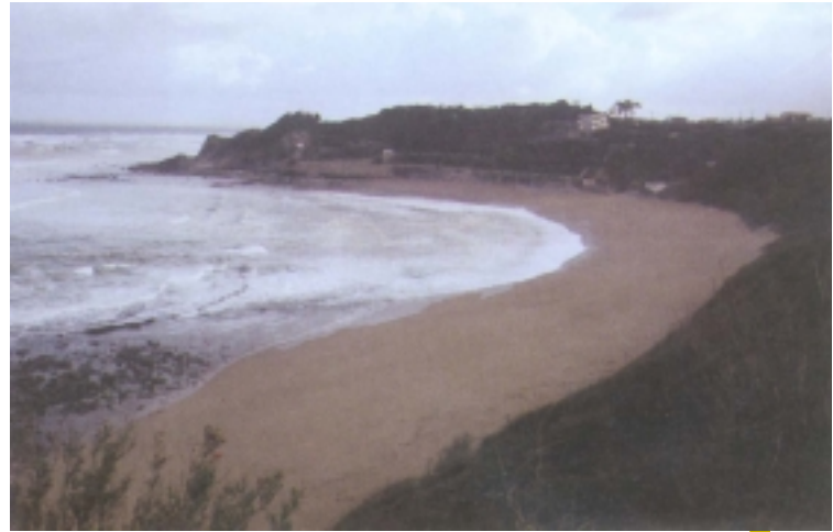
Akotz hondartza. Donibane-Lohizune.