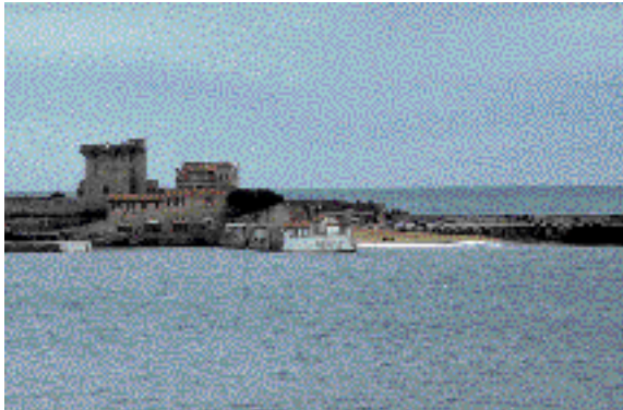
Sokoako gotorlekuaren azpiko hondartza. Ziburu.

takoak, errekaaren kanalizazioa eta errepidearen eraikuntza egin aurretik, duna txiki baina interesgarriak zituen, baina gaur egun ez da altxor horretaz ezer geratzen. Bestea, Sokoako gotorlekuaren azpian dago eta neurri handi batean artifiziala da, badiaren ezker aldeko dikea eraikitzearen ondorioz sortu baita.