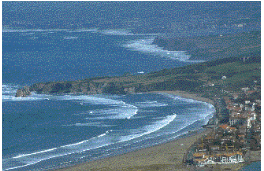
Sokoako Untxin hondartza. Ziburu.