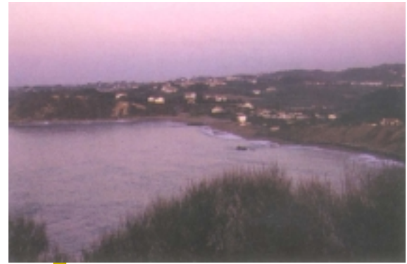
Erromardieko badia eta hondartza. Donibane-Lohizune.