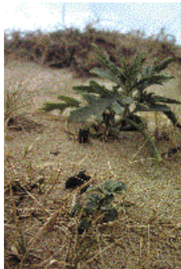
Cakile maritima eta Honcknya peploides landareak Bidarteko dunetan.

tean hitz egingo dugunez, oraingoz utzi egingo dugu.