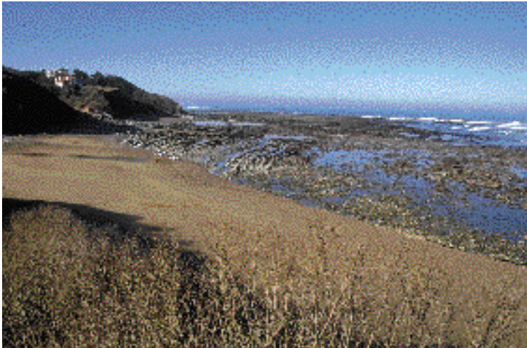
Maiarkoenia hondartza. Donibane-Lohizune.