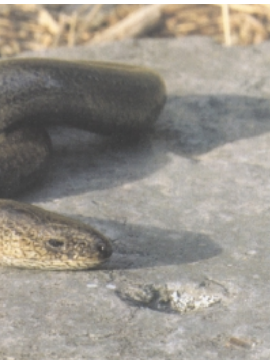
Zirauna ugaria da, Euskal Herriko isurialde atlantiarrean batik bat.

tatik ikusiz gero, begi txiki eta ilunetan nini arre gorritzeta eta iris beltza atzeman daitezke.