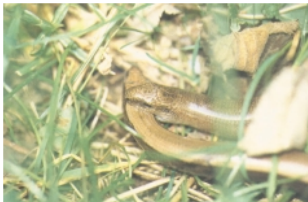
Kopula burutzeko, arrak emea lepotik hozkatzen du eta gorputzak kiribilkatzen dituzte.

Elikadurari dagokionez haragijalea da. Bareak, zizareak, marraskiloak, armiarmak eta intsektuak jaten ditu, ehizean zein irensteko orduan patxada handia erakutsiz. Bere etsaien artean trikua, azeria, basurdea, mustelidoak, hegazti asko, eta sugeak nabarmentzen dira. Eta giza-