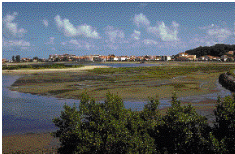
Txingudi. Hendaiko padura (Beltzenia).

duzuenez, hauetako bakoitzaren bukaeran, orain dela gutxi arte padura zoragarriak zeuden.