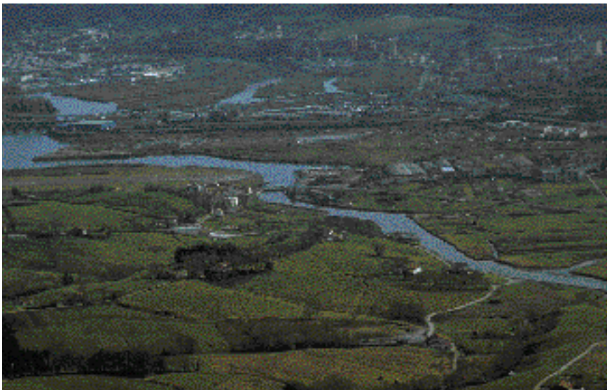
Txingudi. Jaizubiako ibarra. Atzean Plaiaundi eta Bidasoako irlak.