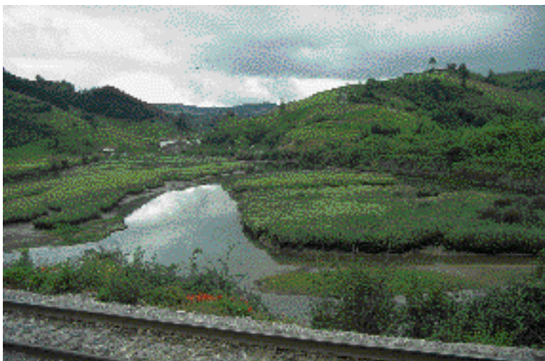
Oriako padura. Portuetxeko padura (Aia), Gipuzkoan dagoen ederrenetakoa da.