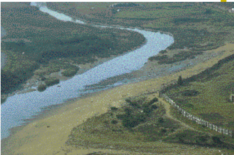
Zarauzko padura. Inurritza erreka padura txiki bat kontserbatu du.

Aizkorriko mendikatean jaio eta 55 kilometro igaro ondoren, Urola ibaia Zumaian itsasoratzen da, Euskal Herriko itsasadar politenetakoa sortuz. Itsasadar honetan, zabalera handiko padura-alderdi pare bat mantendu da: Bedua eta Xantixo, bietan ekosistema honetako landaredi halofitoaren ordezkari garrantzitsuak ezezik, migrazio-garaian bereziki, hainbat eta hainbat hegazti-espezie desberdin ikustea normala delarik. Adibide modura, Beduan, Gipuzkoako lertxun hauskararen ( Ardea cinerea ) populazio negutiar handiena aurki