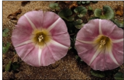
Dunetako lurruntza ( Calystegia soldanella ).

runeak erabat desordenatuta daude,... Baina, European sartu garela edo, arduradun politikoaren artean nabari da politika-aldaketa. Ageri da Natura babestearen aldeko joera minimoa. Ari dira, han-hemenka estudioak egiten eta horrek guztiak, nire iritziz, izango du eragina. Politikariak ohartu dira (batzuk bederen), bizitza-kalitate minimoa mantendu nahi bada, ezin dela Naturari bizkar emanda egin. Bestalde, Euskal Herria txikia denez, dauzkagun baliabide ekologikoak nahikoa ongi ezagutzen ditugu eta geratzen diren apurrak babesteari ekin behar diogu."