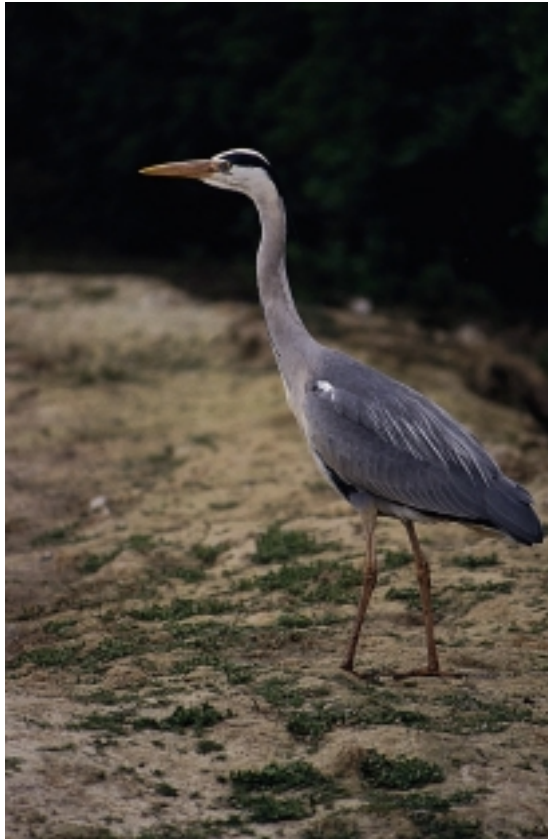
Lertxun hauskara ( Ardea cinerea ).