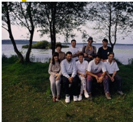
Zarauzko Izadi Taldea Landetako inguruneak bisitatzen.

Bidean aurkitu dituzten oztopo edo zailtasunei buruz galdetu diogunean, ez du inolako zalantzarik Udalaren aldetik aurkitzen