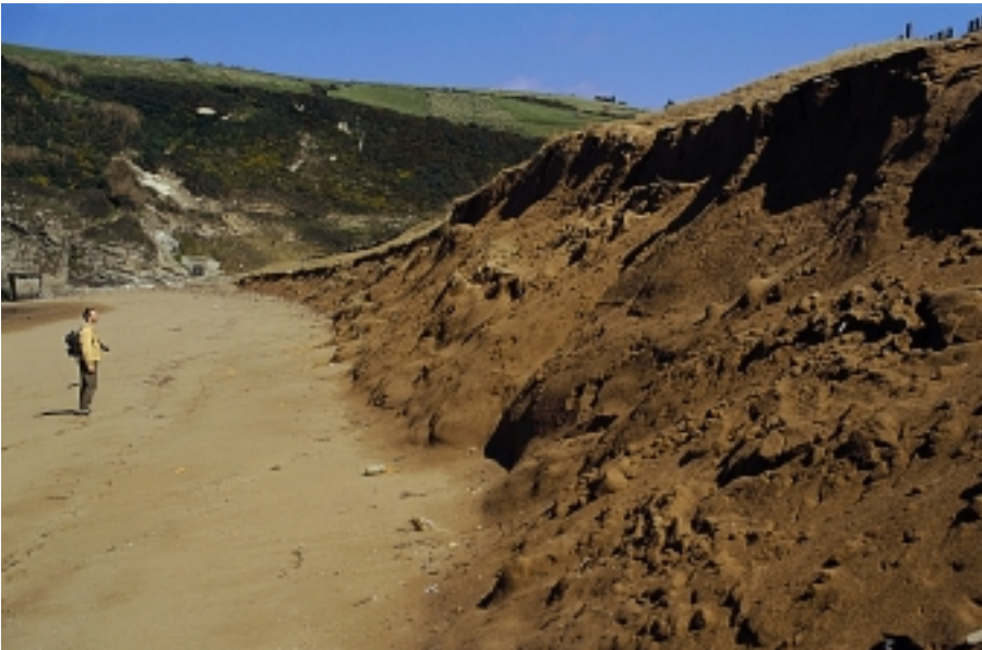
Zarauzko dunak, Izadi Taldeak aztergai duen puntu interesgarrietako bat da.