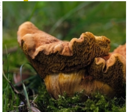
Mikologi saileko partaideak taldeko sortzaile eta zutabe dira.

Industri krisiak naturazaleen mugimenduaren aurka izan dezakeen eraginaz galdetuta, nahikoa baikor agertu da Terés jauna. Naturarekiko hasierako boom-a apaldu egin dela eta industri krisiak naturazaleen kontrako jarra (lanpostuekin zerikusi zuzena dutenean batez ere) areagotu egiten duela aitortu arren, NATURA ezin da gehiago hondatu. Gehiago hondatuko balitz, katastrofea litzateke. Ibaiak erabat poluituta daude (European, lehen edo bigarren lekuan gaude), enpresak direla eta herrietako ingu-