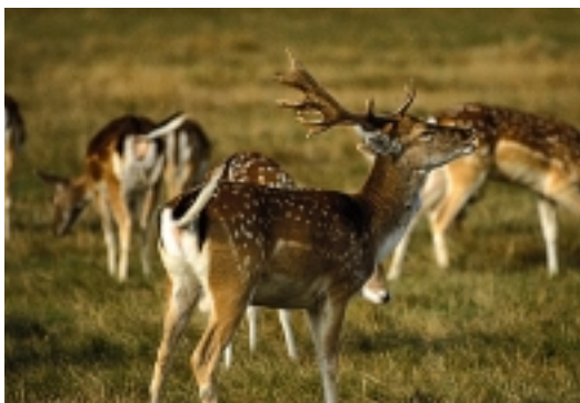
Araldia urrian izaten da eta, elkarren artean lehia egin ondoren, ar sendoenek emeak estaliko dituzte.

Ihesaldietan tente erakuts dezakeen buztana, orkatz eta oreinen aldean luzea da, 15-20 cm-koa eta kolore beltzekoa, ertz zuriekin. Zuriskak edo horiskak dira, bestetik, adarzabalaren azpialdea eta saihe-tsak.