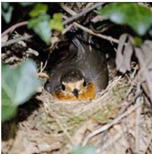
Txitatzean inor inguratzen bada, geldi-geldirik egoten da bere mugimenduek etsaien begirada erakar ez dezaten.