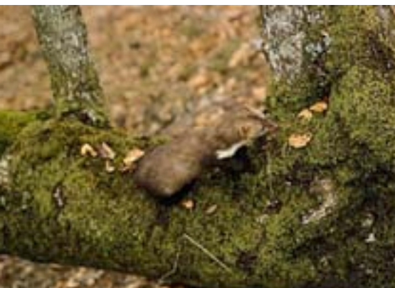
Lepazuria ia Europa osoan bizi da, Britainiar irlak, Eskandinavia eta Mediterranioko irletan izan ezik. Euskal Herrian ere zabal banatua dago.

nerakoan kolore marroi argi edo arrea ageri duelarik.