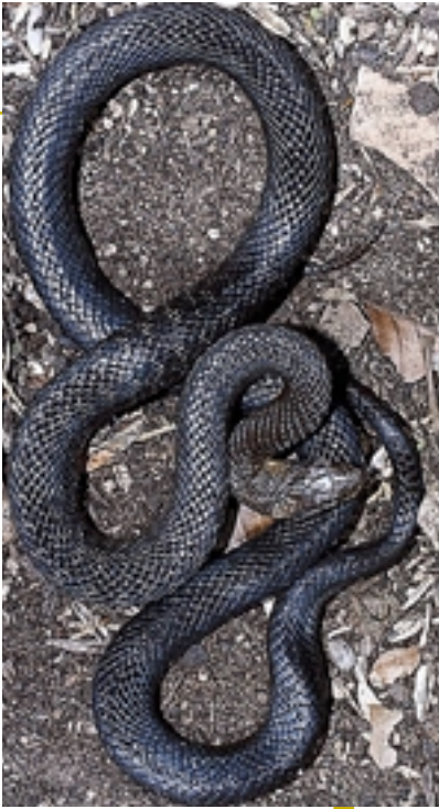
Elaphe longissima suge leun eta liraina osasunaren zaindaritzat hartu zen antzinako zenbait herritan, eta greziarrek, esaterako, Asklepio osasunaren jainkoaren ministrari zela sinesten zuten.

ordea; ezkata bentralen alde askeen ertzetan dituen karenak oso lagungarri gertatzen baitzaizkio lan horretarako. Eguzkizalea den arren, bero handiegia ez du maite, eta temperatura gogokoenak 26 eta 30 °C bitartekoak ditu, giroak 32 °Ctik gora eginez gero babesleku freskoagoren baten bila ezkutatu egiten delarik. Hau dela eta, Eskulapio sugea egunez bizi da batipat, nahiz eta, tarteka, batera eta bestera, ehizakiren baten bila ilunabarrean ere ikus daitekeen.