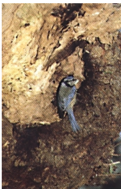
Amilotx urdinak —hegazti troglodita izaki—, haritz, gaztainondo edota bestelako zuhaitz zaharretan ageri ohi diren zulo, tarte eta zartatuak ditu gogokoen, habia bertan egiteko.

Eta gerokoa ere ez da txantxetako kontua: arrautza guztiak errun ondoren txitatu egin behar dira, eta 11 arrautza txitatze askoz ere