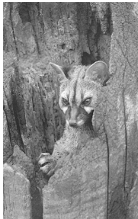
Katajineta arrunta ( Genetta genetta ), felido itxura duen tamaina ertaineko ugaztun liraina da.

legez, katajineta ere ez da ehiza hutsetik bizi, eta bere dieta nahikoa aldakorra izaten da urtean zehar. Udaberrian eta udan hegazti paseriformeak harrapatzen ditu gehienbat, hauek bere dietaren erdia osatzen dutelarik. Udazkenean eta neguan berriz, ehizakirik soberan ez eta batipat fruituak ustiatzen ditu. Karraskariak oster, urte osoan jaten ditu ahal izanez gero,