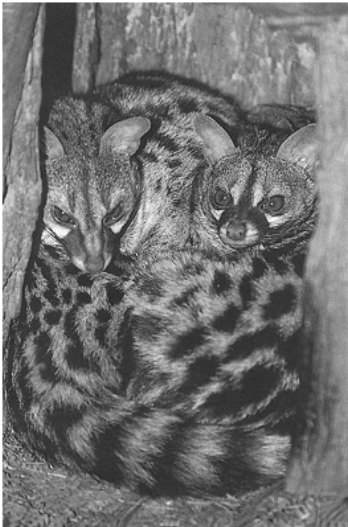
Katajineta ugaria da Euskal Herrian, nahiz eta bere bizimodu ezkutua dela eta jende gutxik ezagutzen duen.

Katajineta gorotz-lekuetan sekulako gorotz-mordoa biltzen da denboran zehar, eta nabarmen adierazten du animalia han dabilela.