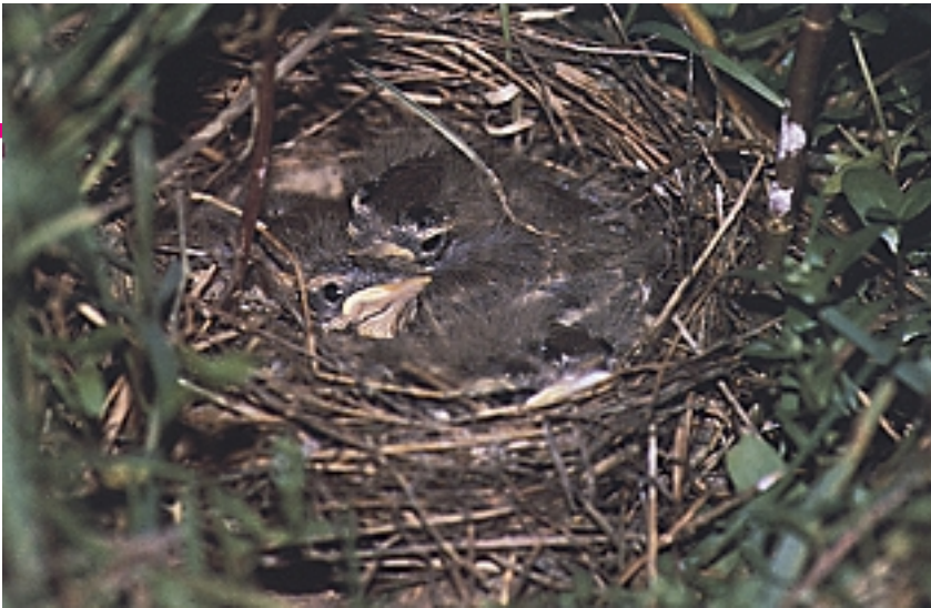
Larre-buztanikarak lurtean egiten du habia, horretarako sustraitxo eta belar ihartuak erabiltzen dituelarik.

arrek mezu akustikoaz gain ikus- mezua ere erabiltzen baitute. Eta horretarako bai! Horretarako bapo datorkie kolore biziz hornituta ego- tea! Bide berean, txori hauen izenak adierazten duen buztana behin eta berrito astintzeko duten ohitura ere, lurrealdearekiko jabegoa iragartzeko ikus-mekanisмотzat jo izan du zenbait autorek.