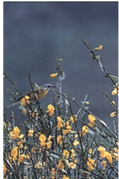
Ehizean ari dela, sarritan sastra- kak, zuhamuska eta zuhaitzak, ha- rresiak eta hesoholak erabiltzen ditu kokalekutzat, eta harrapakina ikusiz gero, hegaldi bizian abiatzen da ehizatzen.

ra hegoaldeko eskualdeetan, eta kostaldean ugaltzen da batez ere; berez espezie honek ez baitu men- diararako inolako zaletasunik, eta bestalde, bere habitat egoki diren larre zabal eta ur-ertzak eskualde hauetan baititu ugarien. Mundu- mailan berriz, oso banaketa zaba- leko txoria dugu, eta habiagile gisara ia ipar hemisferio osoan aurki daiteke. Alaskaraino ere iristen da ugaltzeko sasoiak heltzen denean, nahiz eta udazkenarekin batera Bering itsasarte zeharkatu eta Asiako kideekin biltzen den, negua kontinente horretako hegoaldean igarotzeko.