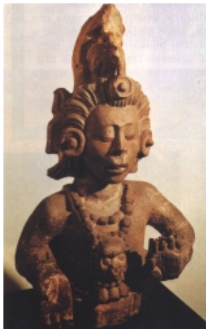
Artoaren jainko gaztea (Maien jainkoa, VI-VIII. mendekoa, Hondurasen aurkitua. Basaltozkoa da). Orrazkerak artoaren hazkuntza adierazten du.

L andare jangarritan, garrantziari bagagozkio, Amerikaren aldera egiten du balantzak, zalan-zarik gabe. Hona hemen datuak: