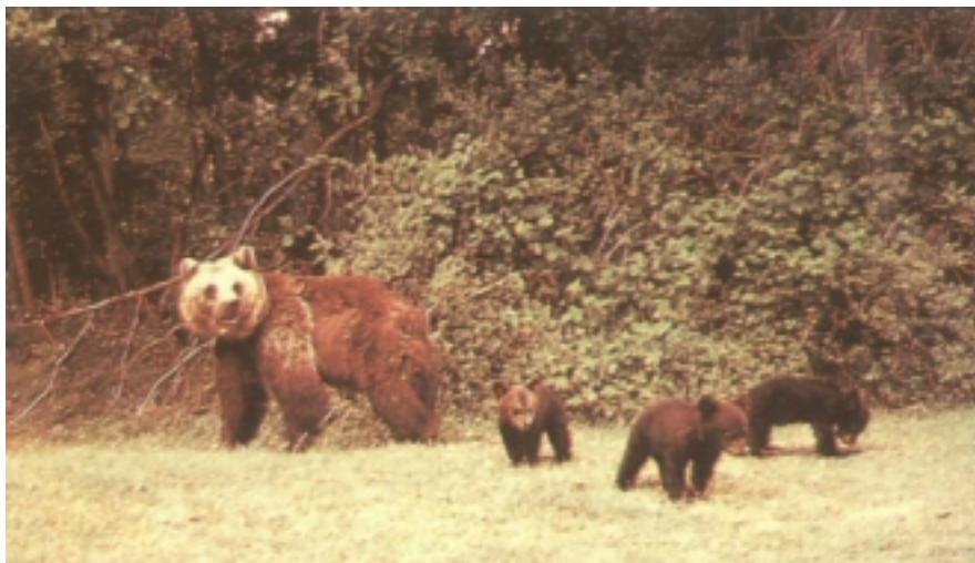
Hartz arrea eta bere kumeak Kantabriako mendietan.

Bista txarra du, baina belarri fina eta usaimen zorrotza. Ekaina aldean ibiltzen dira jotake bikotekidearen bila. Lan zaila benetan, hain dentsitate txikia duen populazioa izanik. Bikotekidea aurkitu eta parekatuz gero hartz bat edo bi jaioko dira. Zorte pixka batekin eta gizaki eta bestelako arriskuetatik urrun ibiliz gero, hogeitamarren bat urtez bizitzeko esperantza izan dezakete jaiaberriek.