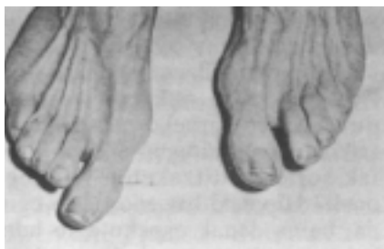
Joanikoteak. Hauxe da oinetako behatzetan agertzen den lesiorik usuena.

Hauxe da oinetako behatzetan agertzen den lesiorik usuena. Behatz lodiaren desbiazioan datza; oin batean zein bietan. Batzuetan