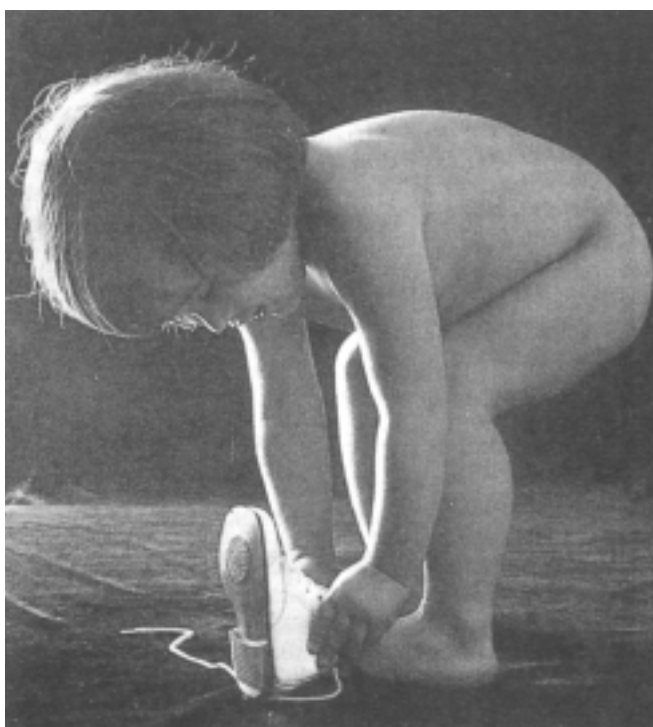
Zapata desegokiak erabiltzeak oinetako lesioak eragiten dituzte.

oinean sortzen diren hezur-alterazioak direla eta, koskor edo irtunene handiak ere agertzen dira eta jendeak horiei deitzen die joanikote .