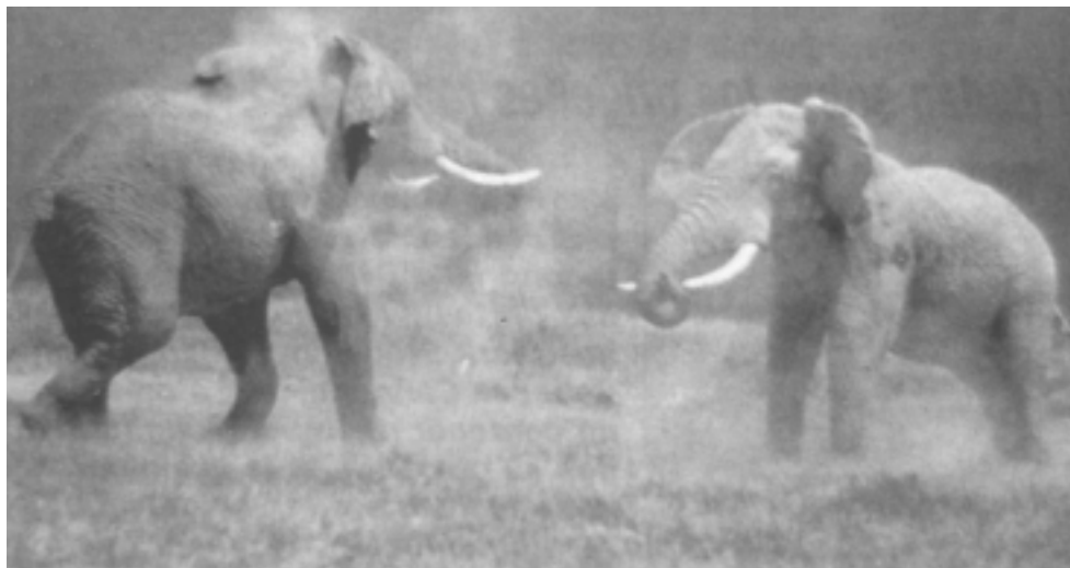
Elefante arrak borrokan

Borrokarik ez da hasten eta lehoi, leopardo eta beste hainbat etsai "konbentzitututa" gelditzen da;