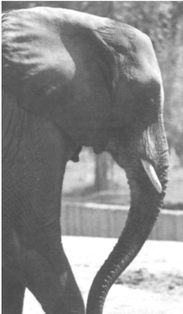
Elefantea eta bere tronpa. Bikote banaezina

ruan metatutako bero-sobera kanporatu egiten du. Aldiz, berorik egiten ez duenean, belarriak geldirik eta gorputzari itsatsita edukitzen ditu.