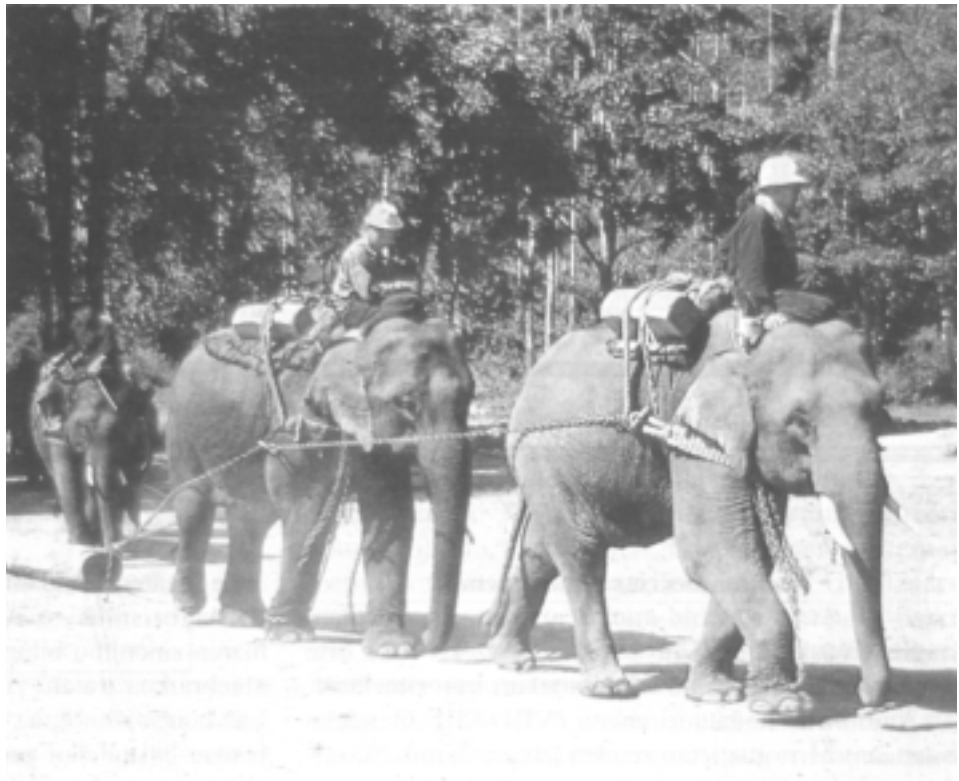
Elefantea abereen artean "lankide"rik garrantzitsuenetakoa du gizakiak

Z ENBAIT herrialde-tan, erraldoi hau animalia basati izatetik etxeko abere bihurtu dute, gauzak azkar ikasteko