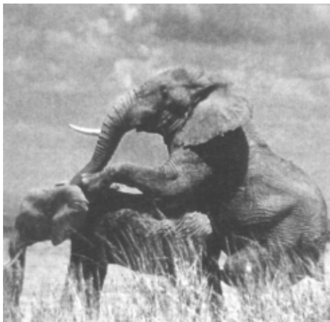
Elefante arra emea estaltzen

Elefante afrikarrak oso nabarmenak ditu bere belarri handiak. Hauen funtzioa tenperaturaren oreka lortzea da. Animalia honek eguerdian jasandako eguzki beroa xahutzeko bere belarriak abaniko bihurtzen ditu. Belarriak hodi kapilarezko saretxo itxi batez osaturik daude eta hauen bidez ba-