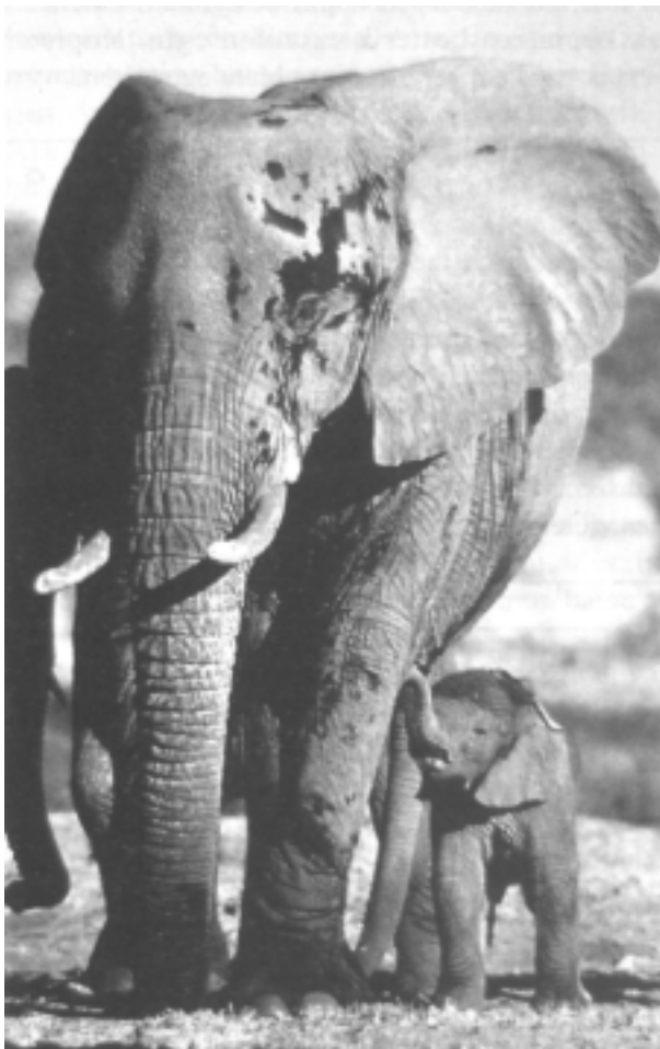
Elefante emea eta bere kumea

duen ahalmenari esker. Bere baldintza egokiak batetik eta segurtasunak bestetik, bere garuna asko garatzeko baliabidea eman diote. "Elefante-oroimena" esaerak argi uzten digu informazioa metatzeko duen ahalmena. Badirudi, bere psikismoa orekatua denez, egoera ezberdinetarako hainbat eta hainbat erantzun emateko ahalmena duela.