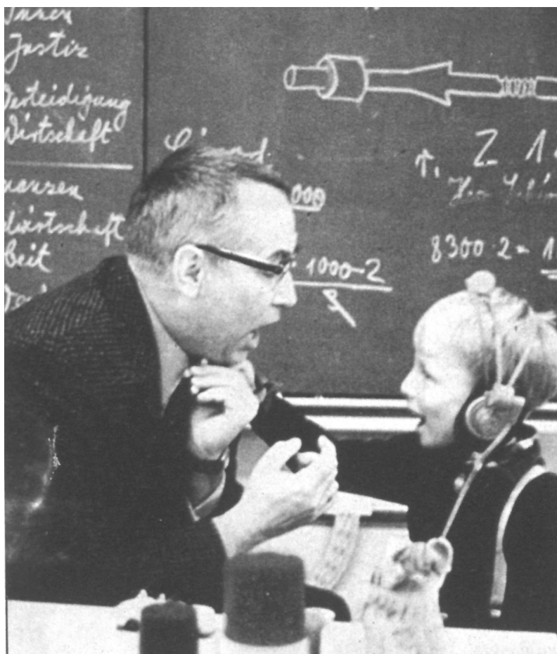
Entzumen-akatsak dituen ume bat gelara sartu aurretik, ikaskideen artean giro ona sortu behar da.

9 Gogoan hartu, ume normalekin gertatzen den antzera (eta kasu hauetan are gehiago oraindik), ume gorra katarro edo hotzaldi bat pasatu ondoren okerrago entzuten duela. Umea espezialistarengana bidali. ●