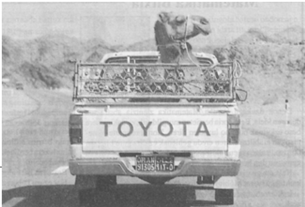
Oman-eko basamortuan oraindik nomadak bizi dira, baina petrolioagatiko aberastasunak Harasiis beduinoei uraren baliabide naturalekiko konfidantza kendu die. Gaur egun sarritan ura ibilgailutan ekartzen dute eta gameluak ibilgailuz garraiatzen dituzte.

Harris-en ustez, denbora luzez irauten duten kulturak presio ekologiko jakin bati erantzunez eraikitzen dira, eta funtzionalki erabilgarri dire-