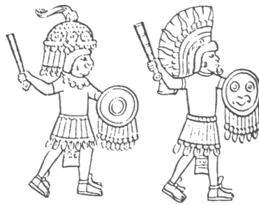
GERLARI AZTEKAK. Azteka orok joan behar zuen soldadu, larrialdietan, nekazariak nahiz artisaauak. Apezek berek ere maiz hartzen zituzten armak.