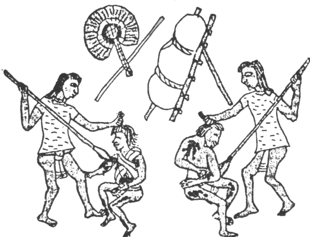
SAKRIFIZIOAK: Aztekek beren Jainko Eguzkiari pertsonen bihotz eta odola eskaintzen zioten.

Biblia Santuak arrazoi erlijioso bat agertzen du Bidaia honi hasiera emateko. Yahve jainkoak, Herri honek Egiptoren azpian zuen sufri-mendua ikusiz, herri Santutzat AUKERATU zuen eta lurralde oparo bat eskaini zion, bitartean frogapiloa pasarazi ziolarik.