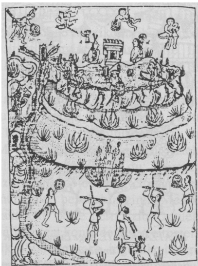
INDIARREN ARTEKO GERRAK. Ertamerikan herri asko bildu ziren elkarren ondoan. Mendek zehar, gainera, iparraldetiko etorkinak ere sartu ziren, jende-uholde ezberdinetan. Elkarren etsai gertatu ziren, ba, sarritan hango herriak. Hona kodize batetik hartutako marrazki hau: Bi hiriren (Tlatelolco eta Cuauhtinchan) arteko gerramoldeak erakutsi nahi ditu.