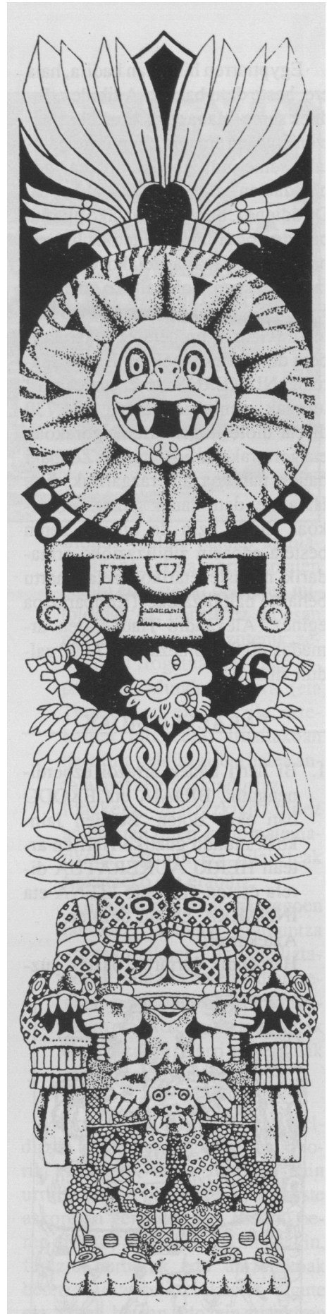
KEATZALKOATL , suge Lumadunaren imajina.

Beheko aldean, HUITZILOPTXTLI-ren imajina, guda-danbor batetik kopiatua.