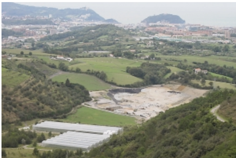
San Markosko agroaldea.

Agroaldearen ideia 1992an sortu zen Euskal Herrian, Oiartzunen, eta gaur egun bost agroalde daude martxan: San Markoskoa (Errenteria-Donostia), Asteasukoa, Arraguakoa (Oiartzun), Astigarragakoa eta Lezokoa, eta beste hainbat bidean dira (Bergara, Irun...). Guztiak jabetza publikoko poligonoak dira, 4.000 eta 10.000 m 2 bitarteko lur- sailetan banatutakoak, hain zuzen ere.