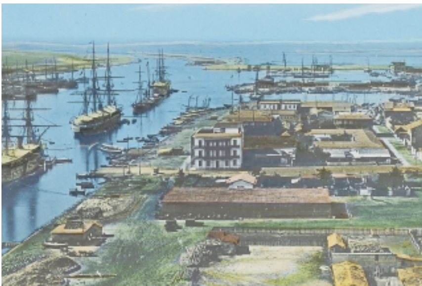
Kanala irekitzeko 5.000 kilometro murriztu zuen europarrek Indiara egiten zuten ohiko bidea.