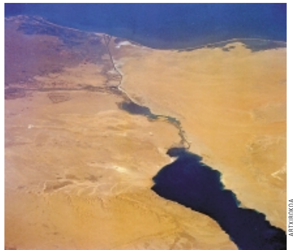
163 km-ko kanalak Mediterraneo itsasoa eta Itsaso Gorria lotu zituen.

Zailtasunak zailtasun, kanalak 5.000 kilometrotan murriztu zuen europarren ohiko bidea. Hainbat hileko buelta