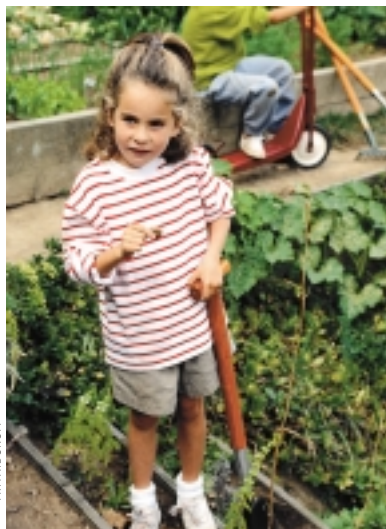
Egin daitekeen okerrrena da umea eskuin izatera behartzea.

“5-7 urte dituen arte ez da erabat finkatzen umea ezkerra edo eskuina izatea”