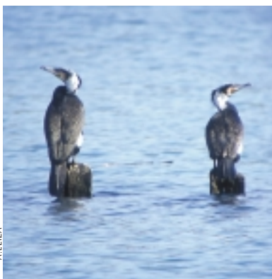
Arraza kontinentaleko ubarroi handiak irauteko babes-neurriak hartu behar izan ziren.

Izan ere, ordura arte ehizatu egiten zen arraza kontinentaleko ubarroia. Eta, horregatik, lehenengo neurria ehiza debekatzea izan zen. Arraza horretako ubarroiak bizi diren herrialde asko oraindik ez zeuden EBn, eta ez zuten araua bete beharrik, baina Batasunean sartu ahala errespetatu behar izan