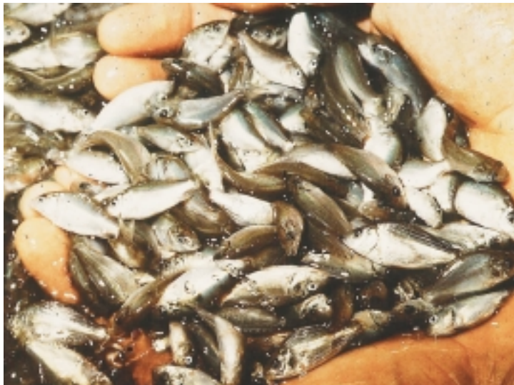
Arrain-haztegietan ubarroiak jan ugari aurkitzen du, eta erraz harrapa daitekeena, gainera.