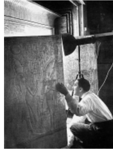
ARTE MUSEO METROPOLITANO