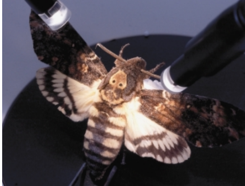
Uztak kaltetu ditzaketen intsektuak aztertzen dituzte NEIKERen.

Astero, NBABk erremolatxaren eta patataren ur-beharrei buruzko informazioa eskaintzen du. Gomendio horiek datu klimatikoetan eta agronomikoetan oinarrituta egiten dituzte. Eta eguraldiari buruzko datuak Euskal Meteorologia zerbitzuko behatoki meteorologikoetatik eta estrategikoki kokaturik dauden behatoki agrometeorologikoetatik jasotzen dituzte.