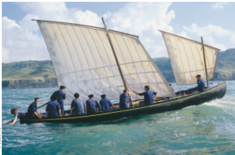
Nahiz eta trainerua arraun egiteko ontzia zen, belak ere izaten zituen haize-boladak aprobeatzeko.