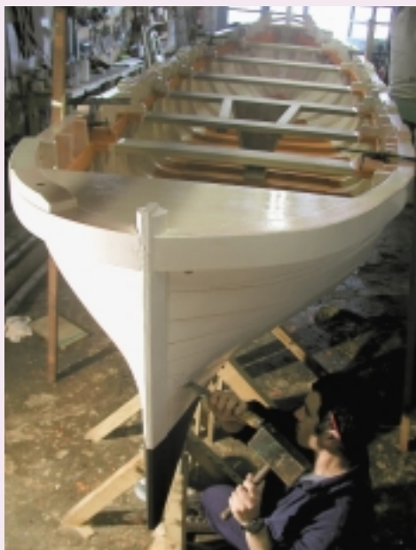
Uretaratu berri duten potina.

XVI. mendean, galeoiak baleak harrapatzera joateko erabiltzen zituzten; Ternuara joaten ziren, han balea harrapatu, eta animalietatik ateratzen zuten olio upe-