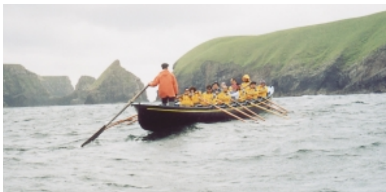
Albaolakoak Irlandako kostan arraunean.

Baina ezberdintasun bakarra ez zen arraunena; ontziaren diseinua ere aldatzen da. Logikoa da: arraun egiteko komeni da txalupak arinak izatea. Beraz, ontziaren urpeko zatiak oso azalera txikia izan behar zuen, urarekiko erresistentzia ahalik eta txikiena izateko; hain juxtu, belaontziek izaten duten diseinuaren alderantzizkoa. Traineruak, adibidez, ez du gilarik, eta belaontzian, berriz, ezinbesteko osagaia da.