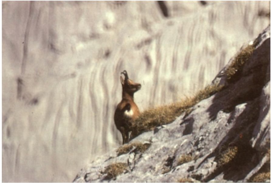
Ar nagusiak bakartiak izan ohi dira, eta araldian ez bada, ez dira eme-taldeekin batera ibiltzen.

antza denez, duela mende batzuk Orhi mendiaren magaletan zehar, Iratin, Abo- din, eta Orreagan bertan ere ugari zirate- keen.