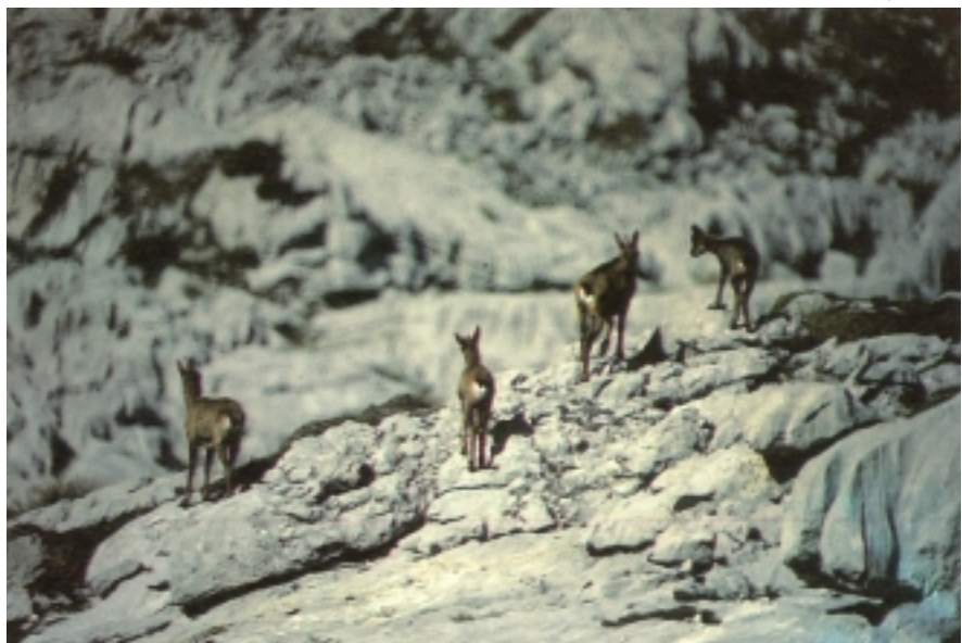
Aralditik kanpo, taldeak sarriokume, eme eta ar gaztez osatzen dira.