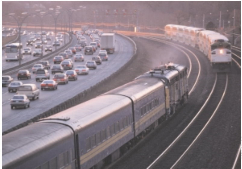
Trafikoa da, zalantzarik gabe, hirietako zarata-iturri nagusia.

Demagun errepide baten ertzean pantailak jarri nahi direla aldameneko auzora zarata gutxiago iristeko; bada, mapan pantaila kokatu eta programak egoera berria kalkulatu du; auzoko etxeetara, parkeetara eta gainerako