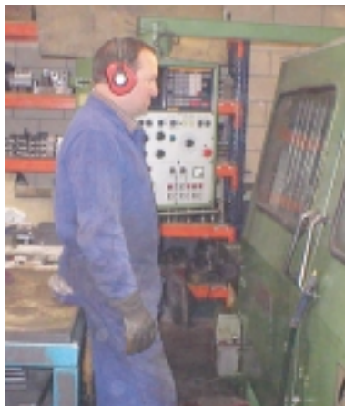
Lantegiek beren araudia daukate zaratari dagokionez.

Zaratak uste baino eragin handiagoa du gizakiongan, eta, behingoz, poluzio-iturri gisa protagonismoa hartu du. Tamalez, hirietan batez ere, izugarri estu lotuta dago gure bizimoduarekin, eta zarata gutxitzeko ohiturak zeharo aldatu beharko genituzke. Eta, hala ere, gizataldeak dauden lekuan beti egongo da zarata. □