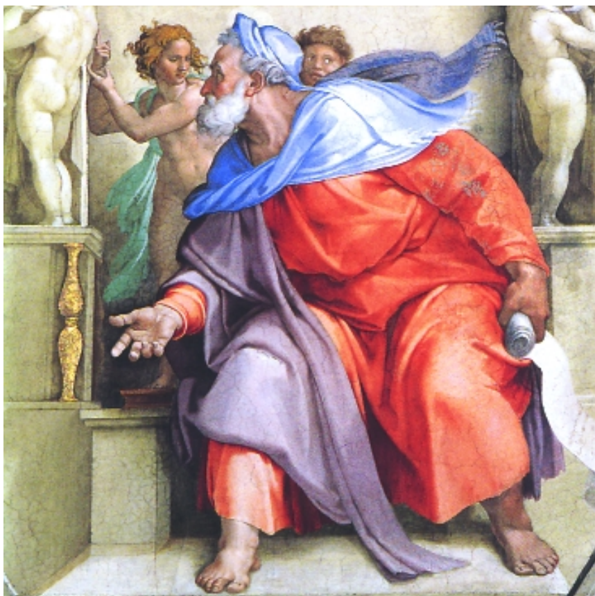
Ezekiel profeta, Kapera Sixtinoa zaharberritu ondoren.

ZENBAT ORDAINDUKO ZENUKE MUSEO BATERAKO SARRERA ikusi nahi duzun koadroa hondatuta balego? Askok? Ezer ez? Arteak interpretazio asko ditu. Adibidez, Rene Magritte ospetsuak uko egiten zien koadroaren mantentze-lanei, eta obra zahartzen uztearen aldekoa zen. Hori aukera bat da, baina ohiko iritzia bestelakoa da.