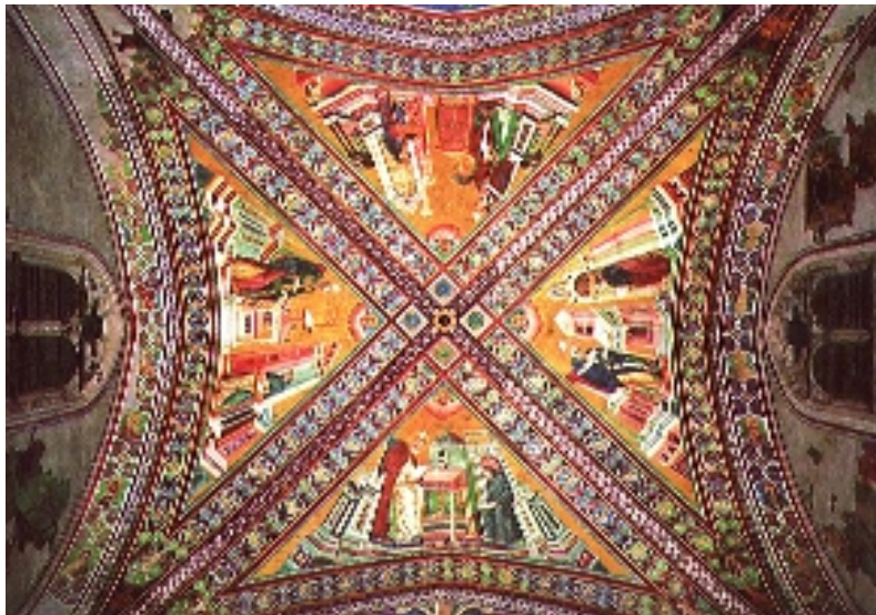
Asisko elizako freso batzuk zaharbertzea lortu dute adituek, lurrikara jasan eta sei urte geroago.

Koadroak horrela gordeta ere, ez daude guztiz babestuta. Nonahi daude bakterioak, nonahi onddoak. Eta koadroa substantzia jangarrien multzo handia da horientzat; intsektuak eta,