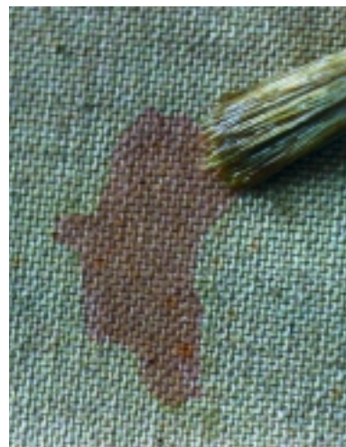
Mihisea zaharbertzeko, azpiko ehunak tratatu behar izaten dira.

Zati handi bat berritu dute dagoeneko; horretarako, ordenagailu handi baten laguntzaz berreraiki behar izan dituzte obrak. Luze dute oraindik, eta dena ez da berreskuratuko. Baina ahalegin