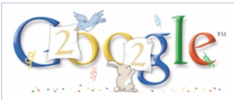
Google-n aldatu egiten dute logoa egun bereziak ospatzeko, adibidez, urte berria ospatzeko.

BESTALDE, GOOGLE ZEITGEIST IZENENKO ZERBITZUAK ( http://www.google.com/press/zeitgeist.html ) urteko gertakizun garrantzitsuenen eta pil-pilean zeuden joeren ikuspegi berezia ematen du.