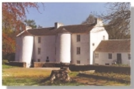
Livingstone esploratzailearen sortetxea.