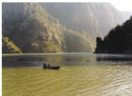
Zambeze, Afrikako ibai handiena, zeharkatu zuen esploratzaile eskoziarrak.

Geroztik, misiolari edo esploratzaile horien abenturak eta bidaiek beste arlo askotan erabili izan dira. Ikusi besterik ez dago komikietan zenbat aldiz atera den misiolari edo esploratzaileen gaia. Batzuek beren lana erabat goresen dute (Tintinen egileak, adibidez) eta beste batzuek salatu.