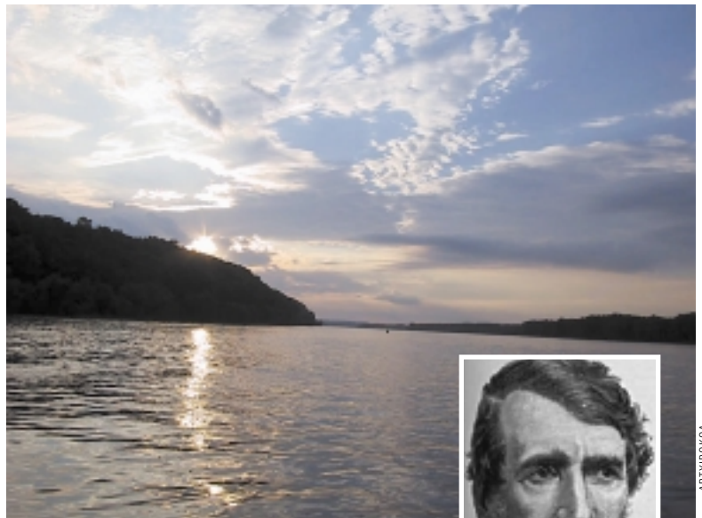
Hamaika baso eta mendi zeharkatu zituen Livingstonek Tete ibaira iritsi aurretik.

DAVID LIVINGSTONE ESPLORATZAILEA ESKOZIAN JAIO ZEN 1813KO MARTXOAN. Familia oso fededuna zen eta horren adibide da 9 urte zituela bere gurasoek Testamentu Berri bat oparitu ziotela Bibliako kapitulu luzeena buruz ikasi zuelako. Hamar urterekin ehun-fabrika batean hasi zen lanean, etxeko zazpiek zer jan izan zezaten. Lantegian egunero hamalau ordu pasatzen bazituen ere, gauak ikasten igarotzen zituen eta 19 urterekin Glasgowko Medikuntza eta Kirurgia Fakultatean lizentziatu zen.