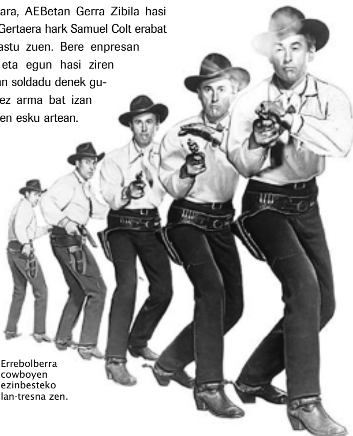
Errebolberrera cowboyen ezinbesteko lan-tresna zen.

Bestalde, 1911n, 45ACP kalibreko pis- toleri esker, Colt errebolber-egileen fa- brika AEBetako enpresarik ospetsuena bihurtu zen. Izan ere, urte hartan AEBetako gobernuak pistola-modelo hori arauzko arma gisa onartu zuen. Horrez gain, Colt enpresak, hirurogei- garren hamarkadan, Vietnamgo gerra- terako bereziki, AR-15/M-16 fusil ospetsua sortu zuen.