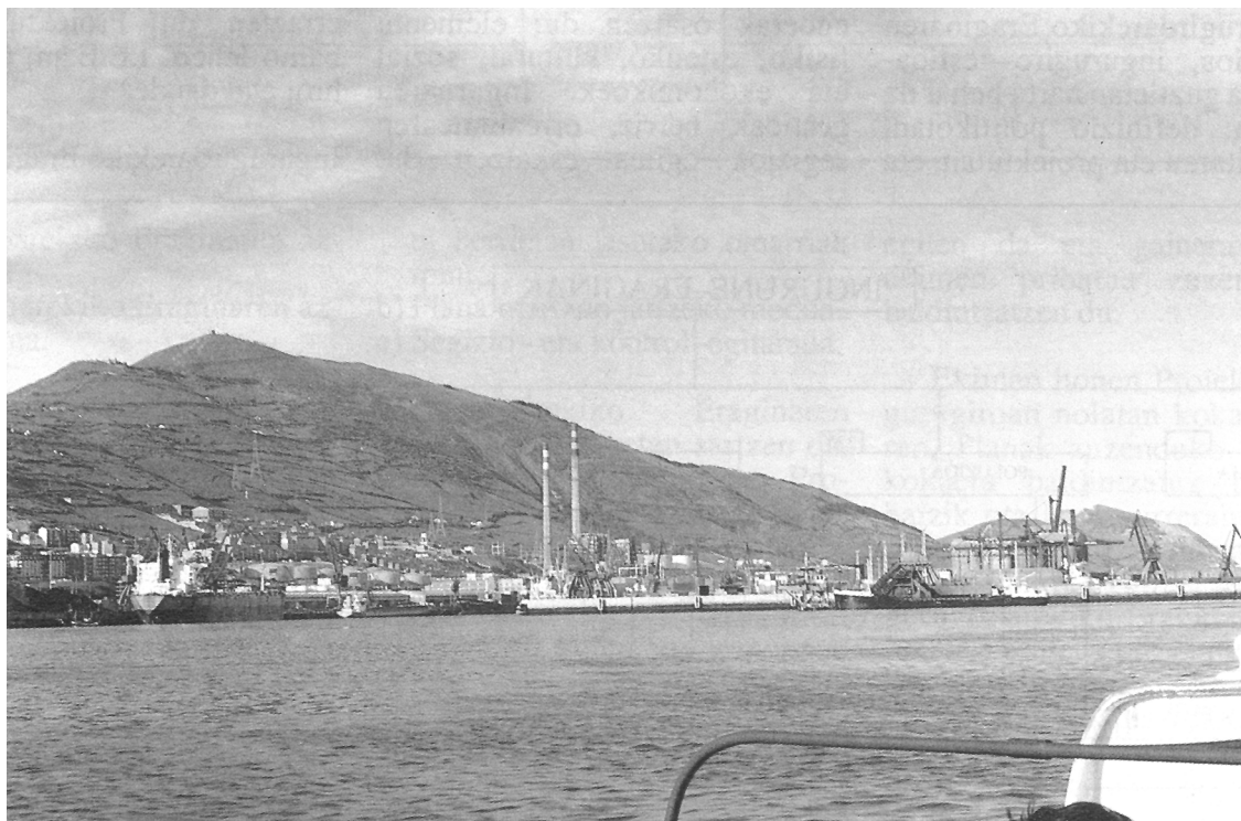
Santurtziko zentral termikoa

Beraz, ipinia zegoen legea. Baina hurrengo arazoa, Estatu espainiarrean horrelako Ebaluazioak egiteko moduko tek-