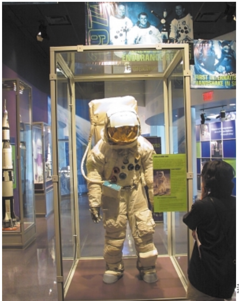
Neil Armstrong-ek Apollo 11 bidaian erabili zuen espazio-jantzia.

1947. urtean, Purdue-ko (Indiana) Unibertsitatean, aeronautika ikasketei ekin zien, baina hiru urte geroago, Koreako gerra hasi bezain, laster, liburuak alde batera utzi eta AEBetako marinan sartu zen hegazkin-gidari profesional gisa. Aipatu gerratean, 78 misiotan parte hartu zuen.