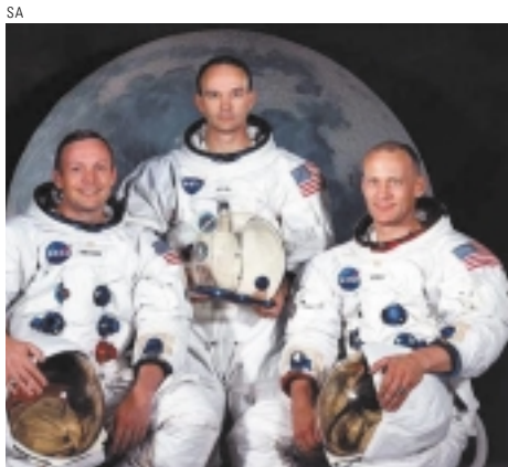
Neil Armstrong komandantea, Michael Collins eta Edwin E. Aldrin pilotuekin.

Aeronautikak betidanik pasio anitz sorrarazi dio Neil Armstrong-i eta bere bizitzan alor horretan beteriko eginkizunak harrigarriak izan dira. Hala ere, bada 1969an Ilargira egin zuten bidaia ezeztatu duenik. Azken horien hitzetan, Ilargian Armstrong-ek pausatu zuen estatubatuar bandera ez zitekeen mugi, Ilargian ez bailegoke haize-mugimendurik. Hala eta guztiz, ezeztapen hori ez da sekula frogatu, eta Neil Armstrong-ek Ilargian oinez ibili zen lehen gizakia izaten jarraitzen du. ☐