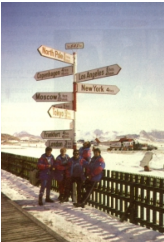
Sondre Stromfiord-en taldea

Arktikoak niregan erakargarritasun berezia sortzen zuen. Urrutiko lurraldea zen, leku hotza eta elurtua eta bertan gizakia bizitzera moldatu zen. Gauer-