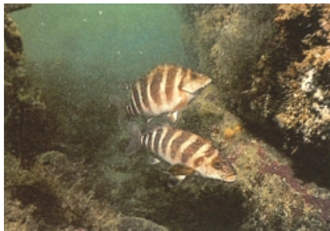
Mokia erabat babestuta Leigh-en.

Zeelanda Berriko Leigh-en, (lehen itsas erreserba, alegia) arauak sinpleak eta hertsia ziren. Nahiz eta arrantzan egiteko debekuak Leigh-en ez dago ezer egiterik esan nahiko zuela uste izan, gero eta jende gehiagok bisitatzen du erreserba. Orain dela gutxi egindako azterketa batean agertzen denez, bisitari gehienek etorri aurretik badakite itsas erreserba dela, badituzte beren ibilbidean arrantzan egiteko lekuak, eta