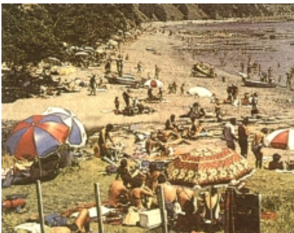
Kontrol hertsia egon arren, Leigh-era bisitari asko hurbiltzen da. Udako asteburuetan hondartza jendez beteta dago.