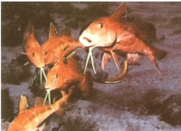
Erreserbak babes mugatua bakarrik eskaintzen die arrainei.

zen publikoaren sektore zabal bat esperimendua baliagarria zenaz konbentzitzea. Publikoak politikariak bultzatu zituen eta hauek, berriz, legez arduratzen ziren administrariak. Ekintza martxan jartzeko prest zeuden unean, nahiago zuten helburu mugatuak zituen metodo alternatiboa.