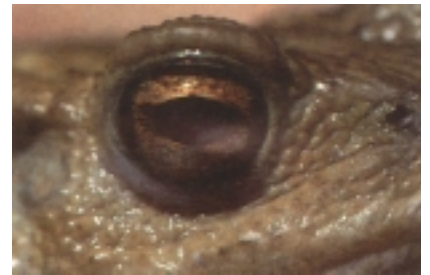
Bufo bufo -ren begia (laranja).