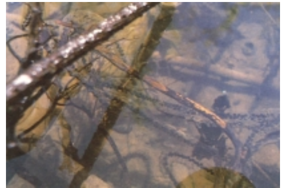
B. bufo -ren arrautzak

Eta itxurari buruz zer esan? Apoari arreta apur batez begiratu dion edonork, badaki jakin gure herriko gainerako animalien artean honen su-kolorezko begiak bezain bitxirik aurkitzea zaila dela. Itxura orokorrari dagokionez or- dea, apoaren edertasuna –edo edertasu- nik eza (?)– bere bizimoduari dagokiona