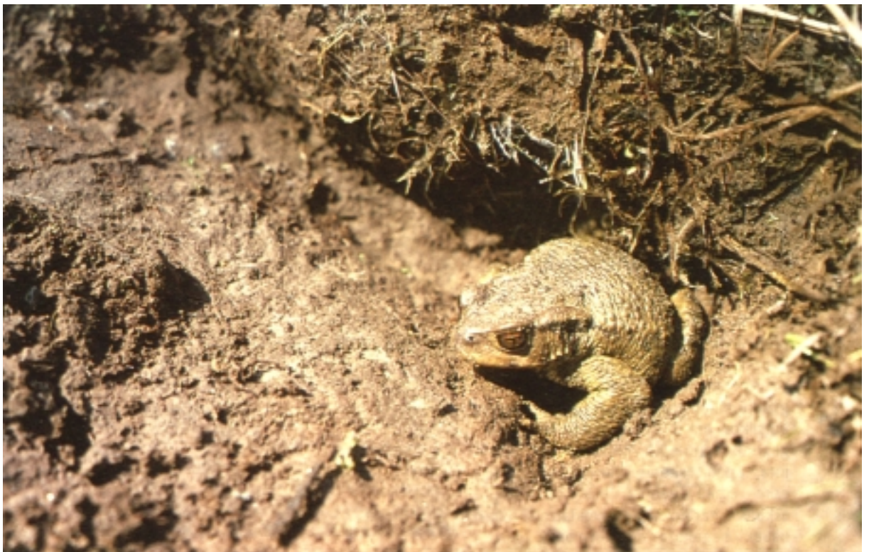
B. bufo , lokatzarekiko mimetismoa.