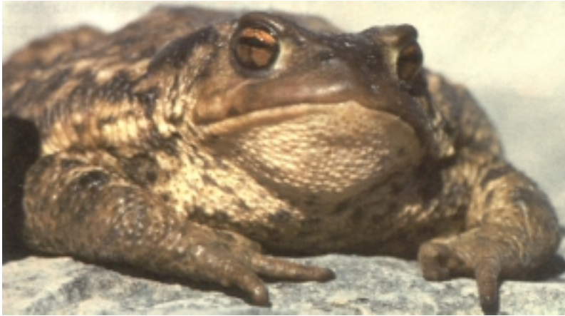
B. bufo , apo arrunta; emea.

Normalean animalia bakartiak ba- dira ere, udaberrian putzu eta erreketan biltzen dira ugalketarako, gainerako anfibo gehientsuenak bezalaxe. Sasoi honetan arren arteko borrokak ugari izaten dira. Akoplamendua –edo an- plexua– zenbait egunez luza daiteke, eta denbora honetan emeak milaka arrautza jartzen ditu, metro batzuetako luzera duten lokarritan. Azken obuluak ernaldu ondoren bikotea banandu egiten da, berriro ere bizimodu bakartiari ekiteko.