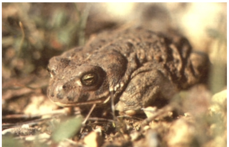
B. calamita , apo lasterkaria.

Banaketa geografikoari begira, apo arrunta ( B. bufo ) askoz ere hedatuagoa dugu apo lasterkaria ( B. calamita ) baino, eta ia Euskal Herri osoan aurki daiteke, nahiz eta Kantauri aldean hegoaldeko eskualdetan baino ugariago izan. Apo lasterkaria ( B. calamita ) aldiz, hegoaldean bakarrik aurkitzen da, salbuespen bakarrak kostaldeko koloniatxo batzuk izanik. Eskualde mediterraneoan bizi diren koloniak sendoak diren artean, kostaldeko koloniatxo hauek galtzar daude. Izan ere, ugalketarako erabiltzen dituzten putzu gehienak lehortu egin bait dituzte. ●