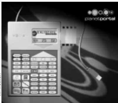
Internet-erako urruneko aginteak 40 botoi eta txartelen irakurgailua ditu.

Internet-ek eguneroko bizitzan duen garrantziaz jabeturik, nabigatzea erraztuko digun urruneko agintea sortu berri dute. Aginte hau 40 botoi eta txartelen irakurgailuaz dago horniturik. Horrela, botoi bat sakatuz bisitatu nahi dugun web-era zuzenean joan gaitzake. Gure ordenagailura beste edozein periferiko bezala konektatzen den aginte honek, web helbide ugariaren sailkapena eskaintzen digu. Sailkapen hau guk nahi dugun erara eta nahi ditugun helbideekin eguneratu dezakegu. Gainera, erabiltzaileen arabera pertsonaliza dezakegu.