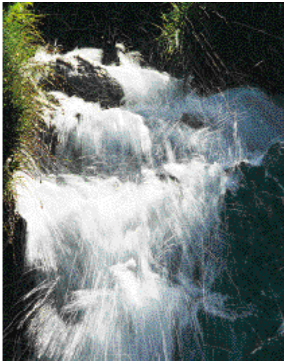
Hainbat gai, uraren kudeaketa adibidez, globalizazioaren aitzakian ezin da erabaki gabe utzi.

Globalizazioarena fenomeno berria da, eta ez da guztiz txarra. Izan ere, gizarte zibilen sustapena bultzatzen du, ingurugiro-langileen aukerak ikustea ahalbide- tzen du, eztabaidatu eta hitz egiteko aukera ere bai. Bai- na globalizazioak bere alde txarrak ere baditu. Mundu globalaren ezaugarrietariko bat merkatu librekoa da. Gu ez gaude merkatu librearen aurka, baina ondo aztertu behar da horren izenean zer egiten den, horren izenean ingu-