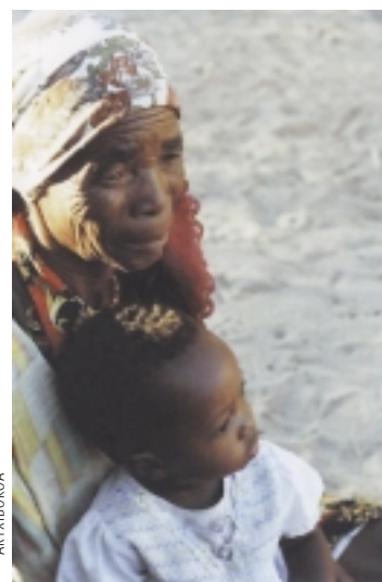
Afrikako zenbait lurraldetan ere, jaiotza-tasak oraindik oso altuak badira ere, azkar jaisten ari dira antisorgailuak maizago erabiltzen diren heinean.

Populazioaren hazkuntzak bere alderdi iluna badu. Afrikan Saharaz hegoaldeko herrietako heriotza-tasak handiagoak ari dira VIH birusaren eraginez. Lurralde batzuetan populazio helduaren laurdena kutsatuta dago. Joan den urtean, AEBetako Errolda Bulegoak kalkulatu zuen bizi-itxaropena Bostwanan 62 urtetik 40 urteraino eta Zimbabwen 61etik 39raino