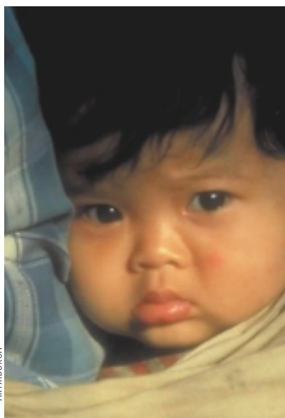
1990. urtean, bost urte baino gutxiagoko 623 milioi lagun zeuden. 1995. urtearen inguruan, 614 milioi besterik ez.

Aldaketa horien arrazoi nagusia emankortasun-tasa jaitea da, garatzen ari diren lurraldeetan, batez ere. Afrika eta Asian ehunka milioi pertsonak, familiako