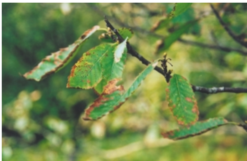
Gaitzak jotako gaztain-hostoak.

Teknika ezagutzen bada ere, gaztainondo erresistenteak lortzea epe ertain eta luzera gauzatu beharreko lana da. Hala eta guztiz ere, horixe da tintari aurre egiteko orain arte aurkitu den irtenbide bakarra. ➔