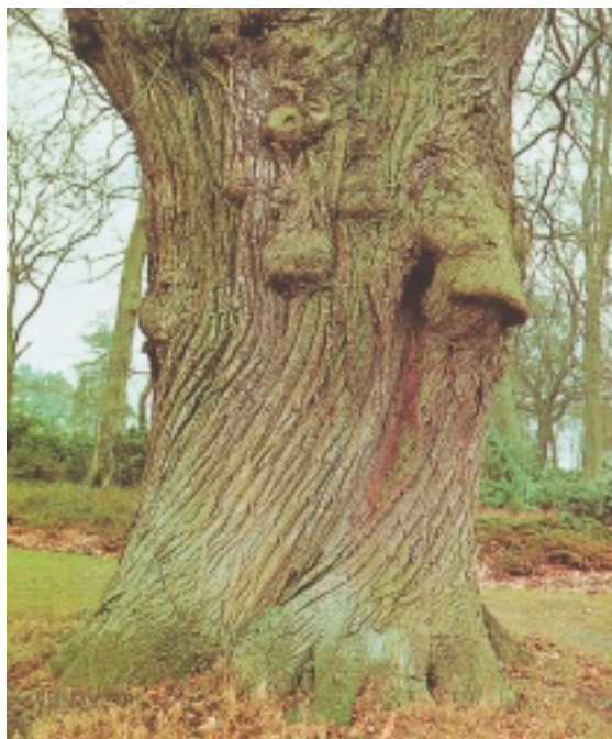
Gaitzez gain, gaztainondoen arriskurik handiena utzikeria da.

Onddoa gehienetan zuhaitzen azaleko zaurietatik sartzen da. Kazkabarrak, adibidez, erraz zauri ditzake gaztainondoak. Gaitzaren sarrera zauriak badira ere, infekzioa zauri horietatik edo azalaren berezko pitzaduretatik, edo adar gazteen intsezioen bidez heda daiteke. Gaixotasunak gaztainondoaren zati altu guztiei eraso egin diezaike, nahiz eta batez ere azalean, eta urtetik urtera hazten den