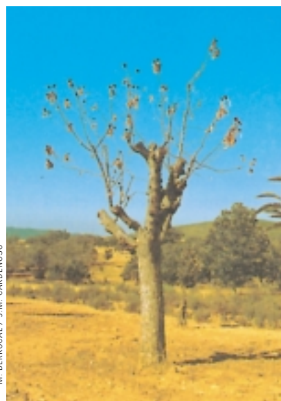
M. BERROCAL / J. M. CARDENOSO

Gaitzez eta ez gaitzez hitz egin behar da gaztainondoaren kasuan, kalte handiena egin eta egiten dutenak bereziki bi baitira: tinta eta txankroa. Tintaren eta txan-