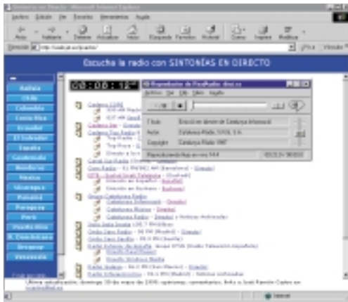
Mundu guztiko irratia entzun ditzakezu Internet-en.

Zalantzarik gabe Internet-ek duen abantaila nagusia mundu guztian sortzen duen lotura da. Irratien kasuan ere berdin ger-