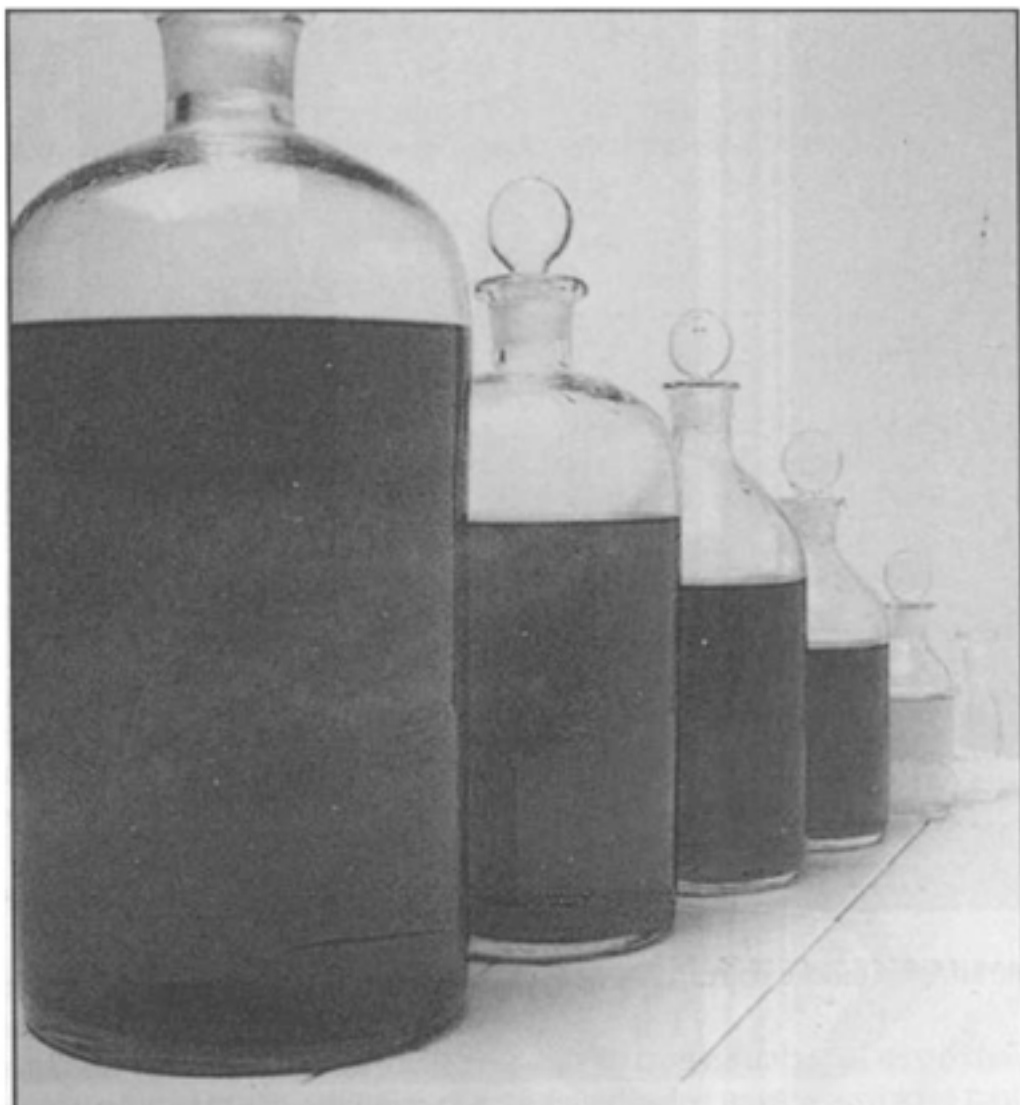
Hahnemann-ek emandako diluzio infinitesimalen printzipioak, hartutako substantzien kantitatea asko txikitzen du eta hauek eraginkorrak dira.

Hahnemannek, berak Bizi-printzipio deitzen duen gizakiaren ikusmolde energetikoa garatzen du. Gaixotasuna Bizi-printzipio honen anabasaren ondorio da eta printzipio hau berrezarri gabe ezin da osasuna berreskuratu. Hahnemann-ek ikuspegitik izakiak animatzen dituen eta beren ekintzak zuzentzen dituen energia da. Bizi-energia honek, osasun-egoera egokia egon dadin nahi-taezkoak diren ordena eta armonia funtzionala mantentzen ditu. Bizi-indar hau aldatzen denean, nahaste funtzionalak