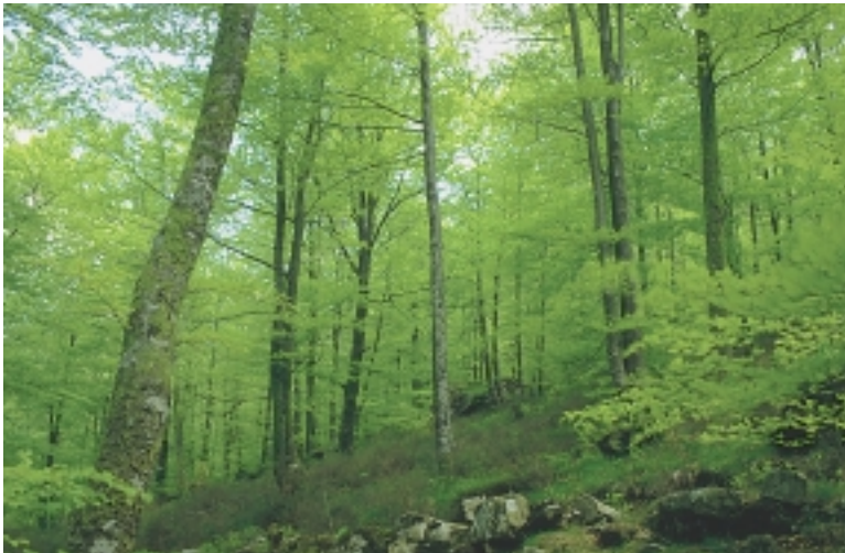
Pagoaren berdetasuna... sinesgaitza.

udaberriko fauna osatua izanen dugula aipatu behar da.