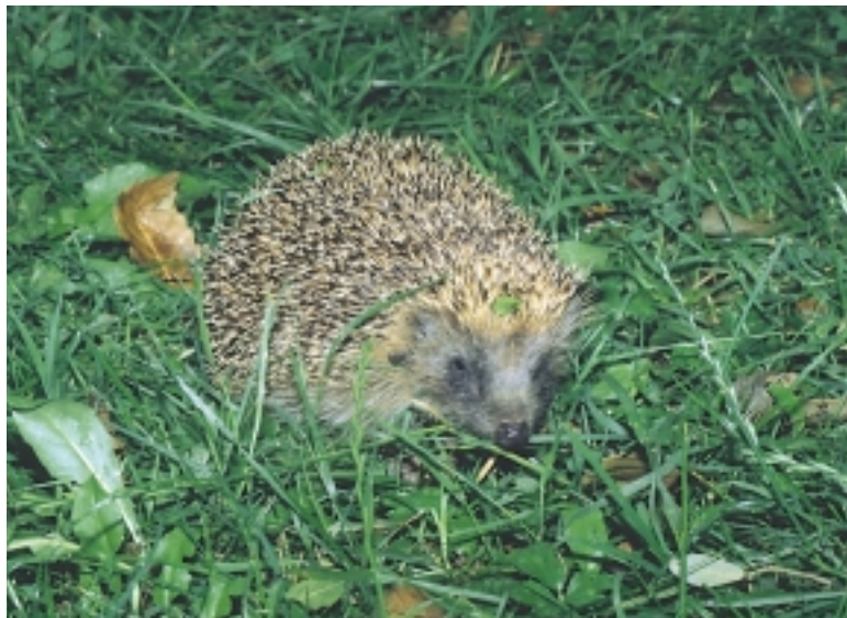
Ilundu orduko trikua martxan jarriko da. Ugaztun arrunta den arren errepedetan gehiegi hiltzen dira.

eskatzea euren kabuz lortzea baina nekosoagoa bihurtzen zaienean, bazka bila hasi beharko dute. Horixe zen hain zuzen ere gurasoek nahi zutena. Txitoak euren gisa molda zitezen, alegia.