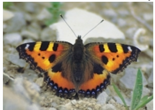
Egun eguzkitsuetan tximeletak nonahi agertuko dira.