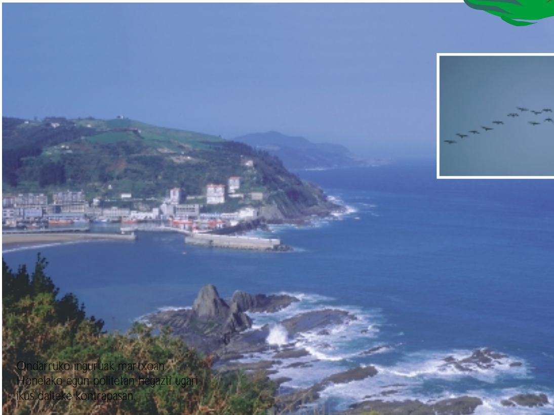
Ondarruko inguruak martxoan. Honelako egun politetan hegazti ugari ikus daiteke Kontrapasan.