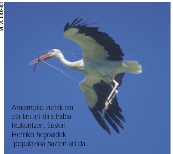
Amiamoko zuriak lan eta lan ari dira habia txukuntzen. Euskal Herriko hegoaldek populazioa hazten ari da..