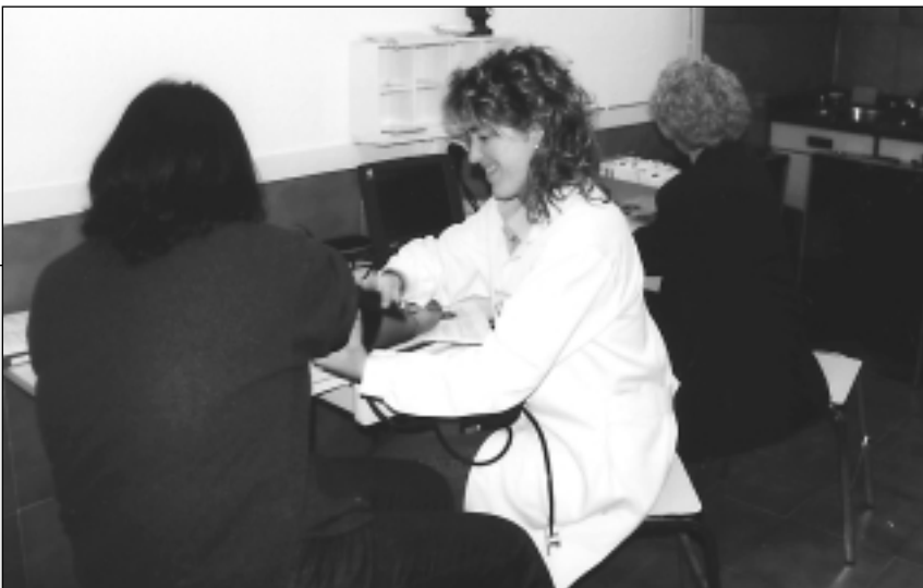
Gipuzkoako Odol Emaileen Elkarte

Tentsioa hartzeak eta anemia duen edo ez aztertzeak odol-emaile babestea du helburu.