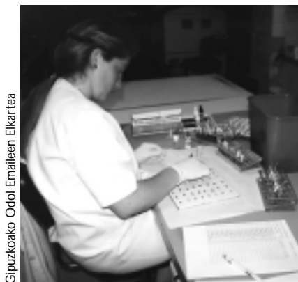
Gipuzkoako Odol Emaitzen Elkarte

Odola ematen duzun bitartean poltsara begiratzeko kemena baldin baduzu, ohartuko zara poltsa bakarra eduki beharrean, bata besteari lotuta hiru poltsa daudela. Zergatik? Kezka bera adierazi genion guk gure solaskideari. Hona erantzuna: “Emaitza bakoitzean 450 cm 3 odol jasotzen da eta horrez gain, beste bi lagin-ontzi ere betetzen dira, ondoren odola analizatzeko. Analiak ongi badaude, bildutako odola hirutan banatzeari ekingo zaio. Lehen poltsa zentrifugatuz globulu gorriak bereiztuko dira: globulu gorriak lehen poltsan utziko ditugu eta gainerakoa bigarrenean. Ondoren, bigarren poltsa zentrifugatuko da eta, oraingoan, plasma eta plaketak bereiztuko dira.” Emaitza bakoitzeko elementuen iraupenaz galdetu genionean, hona zer erantzun zigun: “Globulu gorriek 35 eguneko iraupena