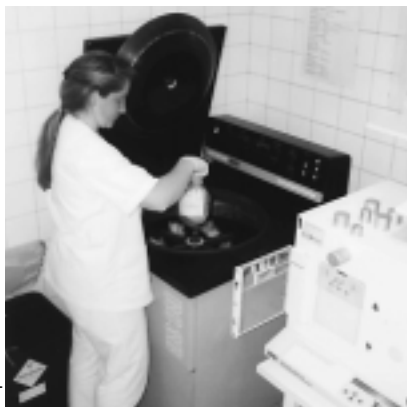
Gipuzkoako Odol Emaitzen Elkarte

3 Emaitza bakoitzetik hematiak, plasma eta plaketak aterako dira zentrifugazio-bidez.