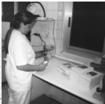
Gipuzkoako Odol Emaitzen Elkarte

4 Banandu ostean, odol-bankuan sailkatu eta gordeko dira.