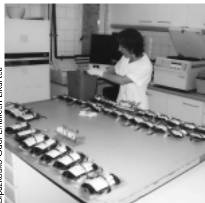
Gipuzkoako Odol Emaitzen Elkarte

2 Ondoren, ontzat eman diren poltsak sailkatu egiten dira.