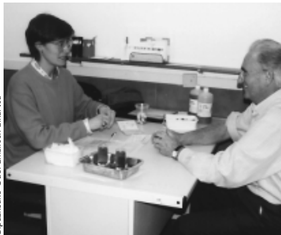
Gipuzkoako Odol Emaileen Elkarte

Odola eman aurretik hainbat galdera egingo dizkio medikoak odola eman nahi duenari.