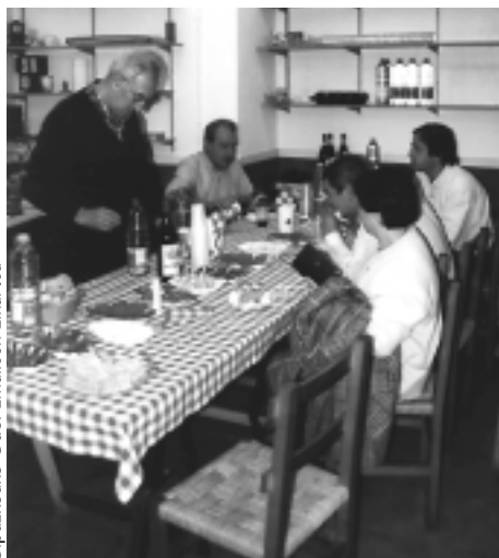
Gipuzkoako Odol Emaleen Elkartea

Odola eman ostean boluntarioek eskaintzen duten mokaduak indarberritzen laguntzen du eta, gainera, lagunarteko giroa ere sortu ohi da.